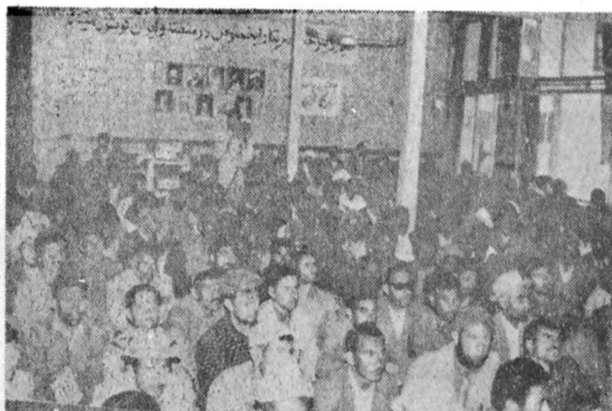
صحنه ای از گردهمایی اعضای شوراهای اسلامی روستاهای گنبد و ترکمن صحرا