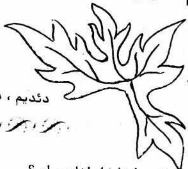
دئدیم ، دئدی