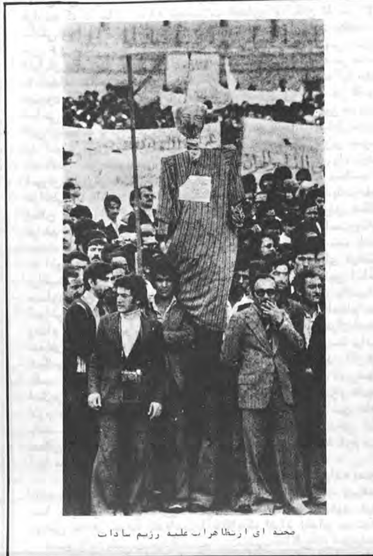
صحنه ای از تظاهرات علیه رژیم سادات

خواستار ارادی این گروه معدود مبنی بر اختلاف قیمت‌ها، طبقات زحمتکش و همچنین کارکنان دولت را قطعا فقیر و فقیرتر میکند. در این زمان که کشور مانند گاولاگری هرروز بیشتر دوشیده میشود، ۶۵٪ درآمدهای بودجه از مالیات‌های غیرمستقیم است که اقشار زحمتکش و ناراضی می‌بازند، در مقابل، مالیات مستقیم برای حرفه‌ای، پزشکی (که بنحو عجیبی تجاری شده است) و همچنین در حرفه خرید و فروش محل مسکونی (دلالتی) در نظر گرفته شده است بسیار ناچیز و از ۳/۵٪ تجاوز نمی‌کند. توزیع تولیدات ملی در مصر یکی از غیرمنصفانه‌ترین نوع توزیع در جهان میباشد: ۲/۳٪ مردم، ۳۴٪ مصارف ملی را برای خود احتکار میکنند درحالیکه ۹۰٪ مردم باید به ۵۰٪ مصارف ملی اکتفا کنند. در دهات یک خانواده، در هر سال ۴ کیلو گوشت مصرف می‌کند یعنی بطور متوسط یک غذای گوشتی در هر ۳ ماه سهم او است. ۱٪ از ۱۴۰ هزار خانواده از فقیرترین خانواده‌های مصر، در یک اتاق زندگی میکنند. تنها در پایتخت ۱۰۰ هزار مصری در بی‌قول‌های قبر مانند یا مردگان عهد عتیق در قبرستان پرافتخار فراغت باستانی، افتخار زیستن دارند. یک سوم از