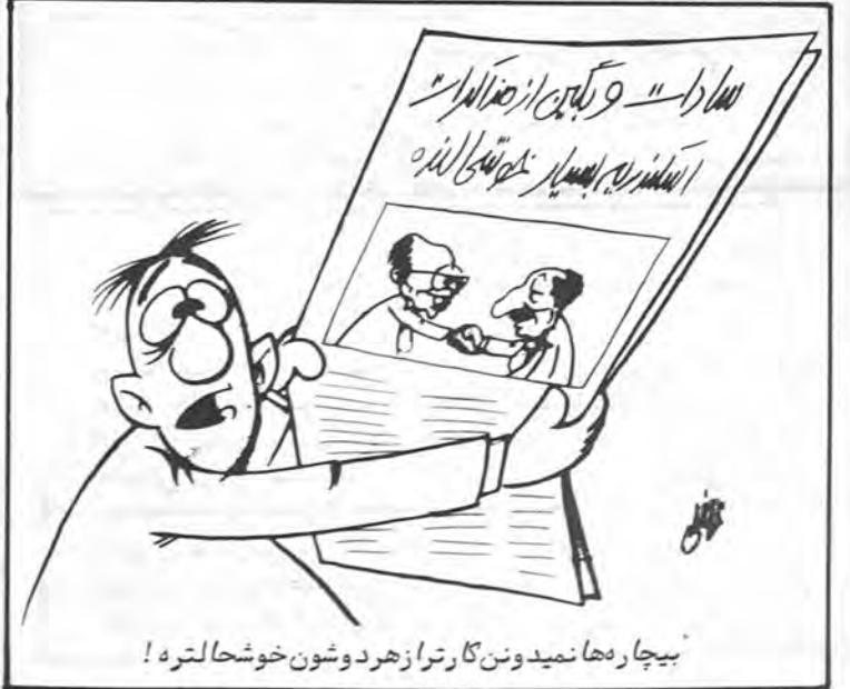
بیچاره‌ها نمیدونن گارترا زهر دوشون خوشحالتره!

روزنامه السقیز نوشته است که تصمیم به اعزام این هیات بدنبال تماسهای پیگیر بیس سازمان آزادیبخش فلسطین و مقامهای سفارت ترکیه در سمرقوت اتخاذ شده است.