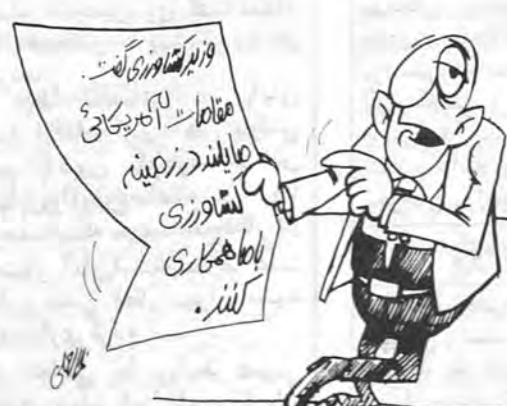
آقا رو ... مقامات آمریکائی در همه زمینها مایلند با ما همکاری کنند!

مدیرمسول: ابو الحسن بنی صدر سرپریر: علیرضا نوبری خیابان جردن - نرسیده به بلوار ناهید کوچ گفهام ۲۲۰۳۲۶ ۲۲۰۲۸۶ چاپ شرکت نفت - سهای مام.