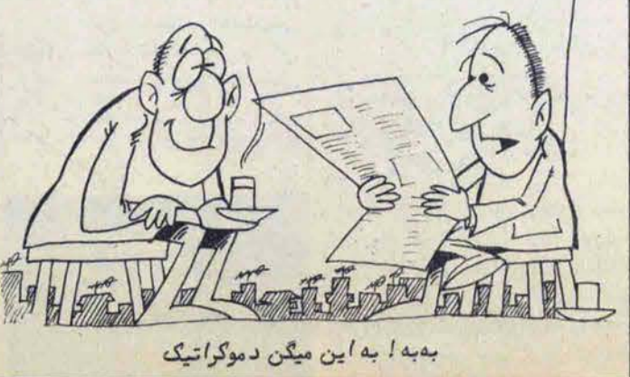
بیمه! به این میگویند دموکراتیک

جمهوری دموکراتیک آلمان به رژیم کابل کمک میکند