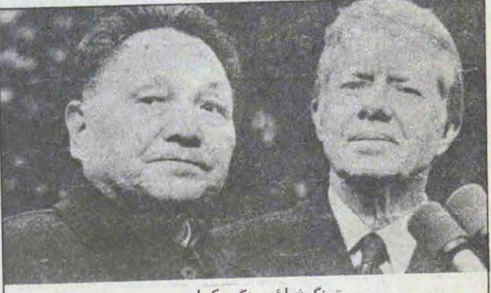
تینگ شیائوپینگ و کارتر