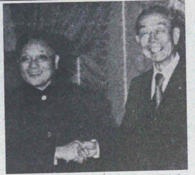
تینگ با تاگوفوکودا پس از امضای قرارداد اقتصادی بین دو کشور