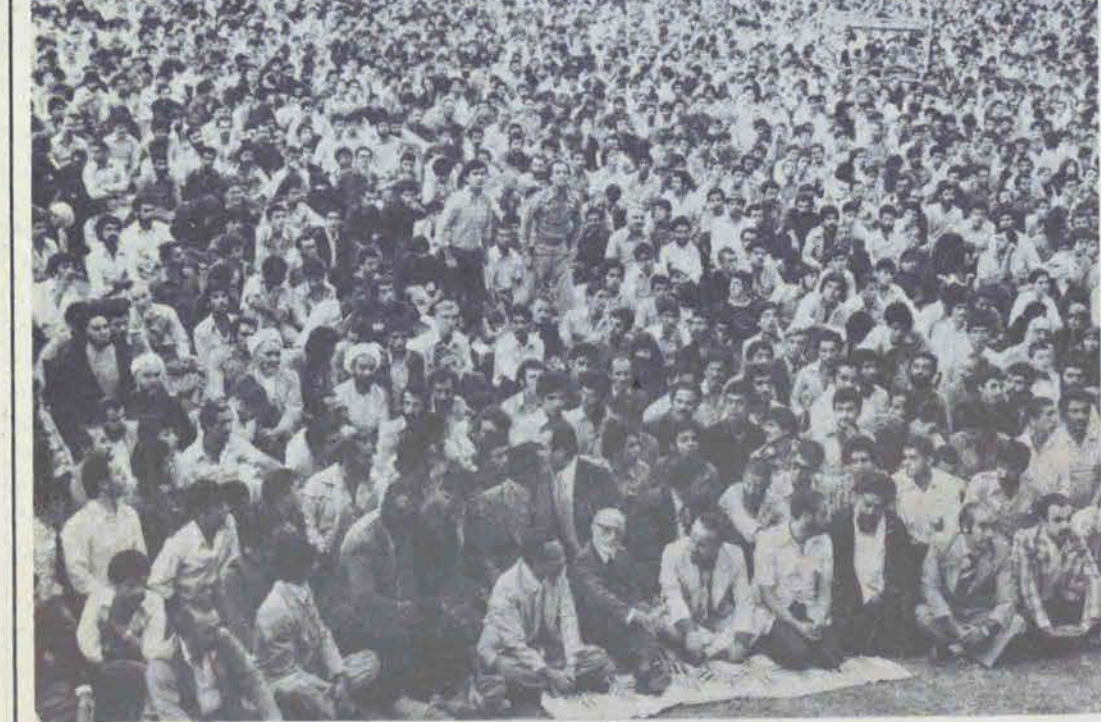
گوشه ای از مراسم بازگشائی دانشگاه تهران

آیت الله منتظری: وابستگی انسانی به کشورهای استعمارگر کشور ما را عقب نگاه داشته است