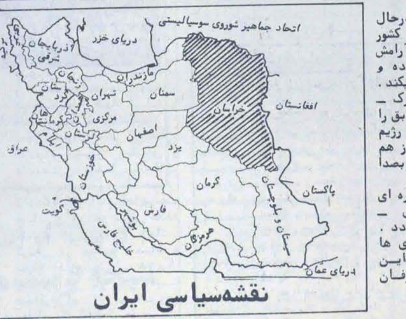
نقشه سیاسی ایران

استان خراسان در حال حاضر آرام ترین استان کشور است. ولی این آرامش را برخی مسائل پشت پرده و پنهانکاری ها تهدید میکند. آسوده باشد که رژیم سابق را به انحطاط کشانید در رژیم کنونی راه یابد و گرنه از هم اکنون رنگ خطر را باید بصدادر آورد.