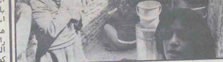
گروه خدمات شهری و غیر تخصصی مشغول بیکردن و بطور متوسط در آمد روزانه ای بین ۵۰ تا ۶۰ تومان دارند. ولی این نکته را باید در نظر داشت که این گروه چون از ترکیب سنی جوان برخوردار است، امکان تغییر شغل را در رابطه با امکانات آموزشی دارند.

خصوصیات اقتصادی: تعدادی از ساکنین در جوار محل زندگیشان، بساط میوه فروشی و سبزی فروشی دایر کرده اند و دیگران نیز به فعالیتهائی از قبیل کارگری، رانندگی، سرایداری، باغبانی و غیره اشتغال دارند. وقتی از مشاغل گذشته آنها قبل از مهاجرتشان سوال کردیم، مشخص شد که حدود ۵۰ درصد آنان بصورت کارگران بخش کشاورزی - خوش نشین های دهات - و گروه خدمات جامعه روستائی بوده اند، و بقیه با صاحب زمینهای کوچک و یا کشاورزان فقیر بوده اند. و در حال حاضر بطور کلی کمتر از ده درصد آن ها در کارهای تولیدی و بقیه د.