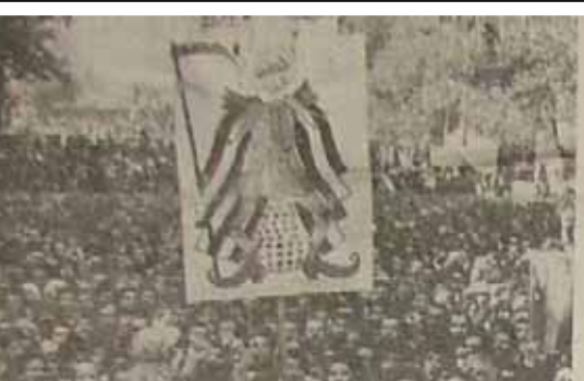
گوشه‌ای از تظاهرات شکوهمند ضد آمریکائی مردم تهران