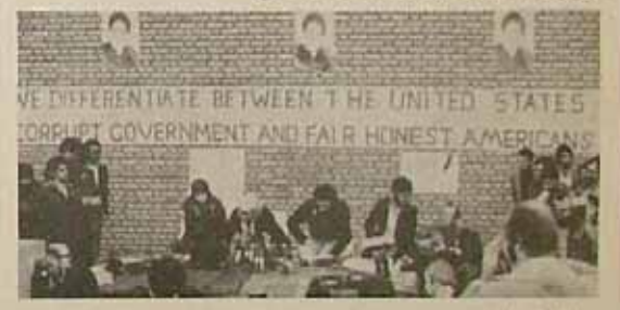
مجلس دانشجویان پیر و خط امام

زبانیکه در حواشی‌ترین شرایط ملکت که وجود یک جنبه واحد و سیاست یکسان در مبارزه با دشمنان بی‌شماره ای چون آمریکا ، پیش از هر زمانی ضرورت می‌آید ، راديو تلویزيون با ساسی کامل ، متعادل با سیاست کلی ملکت پیش می‌گردد.