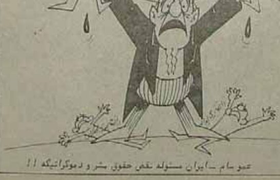
عمر امام - ایران مسئله نفس حقوق بشر و دموکراتیکه ۱۱