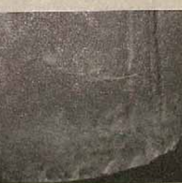
به سائیدگی ظاهر توجه شود!

۲- پس از چندین سال رانندگی و کوشش کلاچ و ترمز و بوس کردن دنده برای یک راننده ذهبا ناراحتی و بیماری بخا می‌ماند ولی برای یک کارآزاد و بیلا - ساختمان و سایر وسایل و امکانات رانندگی - رانندگان با من جان و مالی ندارند بطوریکه اگر روزی در اثر وقوع حادثه تصادفی، گشته نموند خانواده‌شان بی سرپرست گشته است که از آنها حمایت کند همچنین اعتبار بانکی در این شهر را یکصد هزار تومان است ولی کابین اعتباری ندارند.