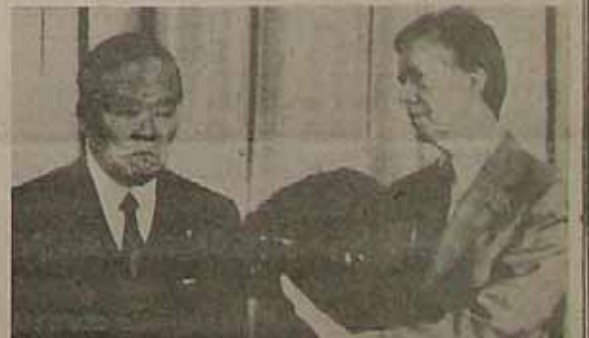
کارتز به ماساچوستی اوپرا نخست وزیر زاین آقا دست نگهدارید