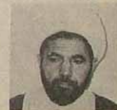
در صفحه ۱۲

جلسه مشترک اعضای شورای انقلاب و وزرا که در شب تشکیل شد حسن حبیبی سخنگوی شورای انقلاب اظهار داشت: گزارشی توسط وزرا به شورای انقلاب داده شد که مهمترین آنها گزارشی بود که رضا صدر وزیر بازرگانی به شورا ارائه کرد.