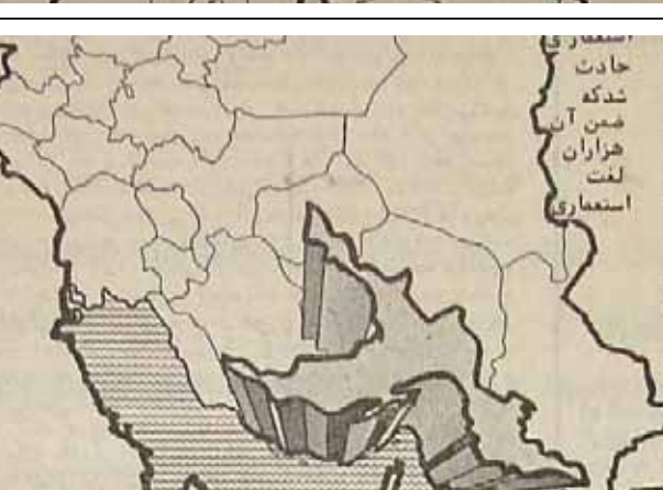
هیولایی بنام فقر

در میان اقشار مختلف مردم و بروج فقر و فساد بوده است. اما جای بسی غرور است که در نهایت فقر و محسرت مردم این سامان امیدوار زندگی میکنند و با نیروی امید همواره بر ناملایمات فائق میشوند.