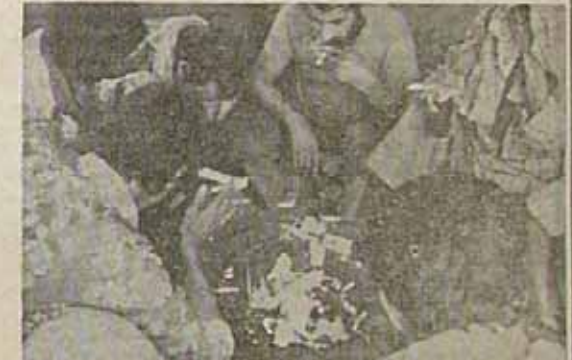
توسط سلفی جمع شده‌اند. یکی می‌گفته از دیگری و همه می‌گفته از خودی تمام زندگیشان در چند گرمی خلاصه می‌شود که به "گرد" می‌گویند. اینست رفایرد استعمار تا خلفیا را اینچنین بدست خودشان پایمال کنند. انتظار داریم که این صحنهها برای همیشه پایان پذیرد.

چشمه سر از آن سازمانهای امداد، درمان، بازرسی، تربیت و کارگاه تشکیل و کار خود را طبق برنامه پیش‌بینی شده انجام می‌دهند. د- نحوه اجرای طرح ضربتی: تعداد قبل از اجرای طرح، سیاست فوانینی شبه فوانین نسل صورت و سطح طریقه ریشه‌کنی و برطرف‌کننده اجرا گذاشته شود. ۱-۱- از این تاریخ کلیه قاچاقچیان و واردکنندگان و توزیع‌کنندگان و متوسلین مردم معواد معدود شدیداً مجازات خواهند شد. ۱-۲- قانون امداد طرح کلیه معاندان از سازمانهای ملی و دولتی مانند پستل نیروهای مسلح به کلیه جمهوری اسلامی ایران و وزارتخانه‌ها با انجام آزمایش‌های لابراتواری و جانسختن کردن آن توسط افراد غیر معناد، مستلزم قانون واگذاری اراضی را زمین معناد به افراد غیر معناد، مستلزم قانون مع کتت خشمناکین در برابر کشور و اعدام کلیه افرادی که غیر قانونی خشمناکین کتت می‌کنند و واگذاری زمینهای اینگونه را زمین بدبختان است که سایر مایحتاج ملنگت و معاده انوال اینگونه را زمین که بطور غیر قانونی گفت‌خاش کتت می‌کنند.