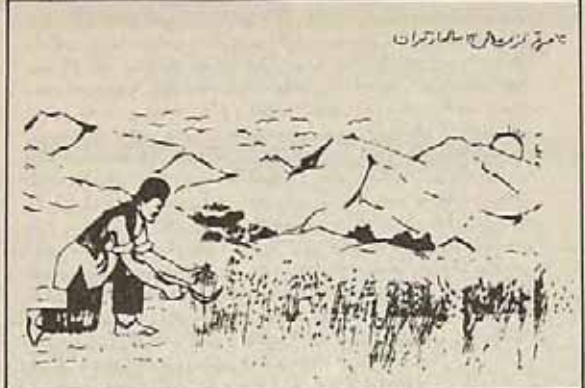
تلاش برای آبادسازی و عمران