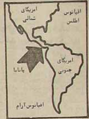
در پاناما چه میگذرد...