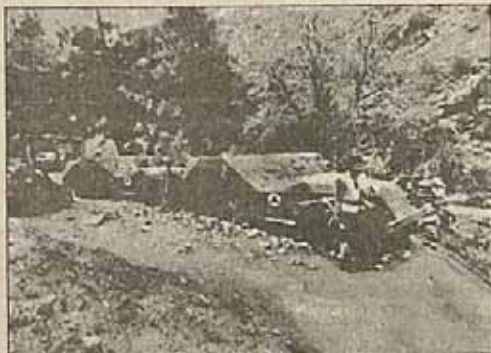
عکس، صحنای بعد از موفقیت مسلمانان مبارز افغانستان را نشان می دهد

از دانشجویان بیروخت امام مصاحبه مطبوعاتی ای بیروخت دعوت - دانشجویان از نهضت های آزادی بخش جهان که از تاریخ ۱۳ تا ۱۹ دی در تهران برگزار می شود تشکیل شد و نمایندگان دانشجویان اطلاعاتی در اختیار خبرنگاران مطبوعات قرار دادند. ابتدا یکی از نمایندگان - دانشجویان بیروخت امام بعنوان آغاز سخن اظهار داشت :