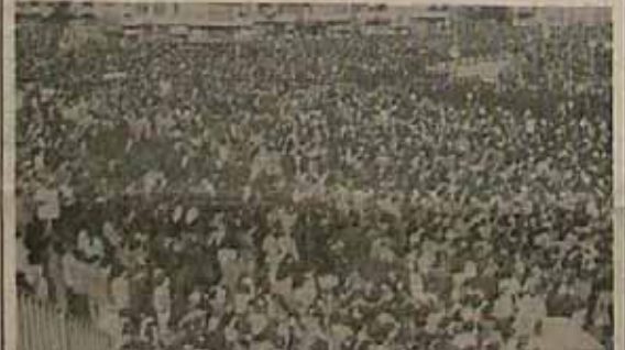
مطالبی باین شرح ابراز فرمودند. درصحنه ۲

بار دیگر در اربعین حسینی ملت ایران انزجار خود را از امپریالیسم آمریکا ابراز کرد