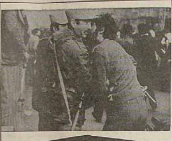
طاغوت از میان برخاست و ارتش و مردم یکدیگر را در آغوش گرفتند

یکی از هزاران سندی که از شاه مخلوع در دست است سند فوق میباشد که حسب الامر ملوکانه مبلغ ۵۹۵۰۰۰۰۰ ریال بابت فقط هشت صد و پنجاه و پنج رتبت کاخ خود پرداخت کرده است که در صورتیکه ما در نظر و گرتنگی بسر می‌بردند در رافه‌ها زندگی می‌گردید. شما باید حساب سرانگشتی متوجه خواهید شد که با پول این ۸ برده میتوانست حداقل تعداد ۴۰ دستگاه ساختمان باقیمت ۱۵۰ هزار تومان برای مردم بی‌پناه ساخته شود. همچنین باید هنوزتان عزیز بدانند که در اداره حسابداری اختصاصی و دربار باصلاح شاهنشاهی و بنیاد پهلوی سابق صدها بلکه هزاران از چنین اسناد حیاتی توسط بانک مرکزی جمع آوری شده که در فرست‌های مناسب بازمه ارائه خواهد شد تا به این ترتیب خاندان کشف پهلوی بیش از پیش افشا شوند.