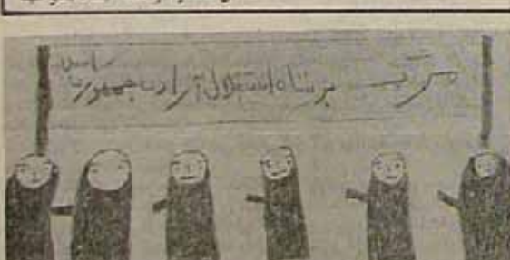
شیرین از بیل و قابیل

شطان از روزی که وادانه داد "چرا اینقدر بوجوت رحمت میدهی؟ یکی از همین گوسفندهای بیعت را برای قربانی ببر برای خدا که فرقی نمی کند، قربانی توجی باشد، او که احتیاج به چیزی ندارد و این نوشی که بگوشت و شد آنها احتیاج دارد."