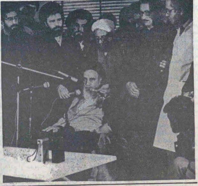
در روز سالگرد پیروزی انقلاب ایران مسکو شاهد نماز جمعه پر شکوه مسلمانان شد

تهران - چهارصدمین سالگرد هجرت پیامبر اکرم (ص) و سالروز پیروزی انقلاب در ۲ صفحه