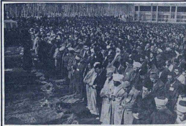
برای خدا و در راه خدا از آن بهره بگیریم.

برای خدا و در راه خدا از آن بهره بگیریم. آنچه ما بان انقلاب اسلامی ایران داده‌ایم به گمان ما ادامه‌ی رسالت محمد (ص) و ادامه راه انبیا الهی است. این ولادت تازه‌ایست که اسلام در عمل وعینیت مییابد. ملت ایران از سالها پیش حرکت عظیمش را برای رسیدن به چنین جامعه‌ای آغاز کرد این حرکت مجموعه‌ئی بود از تلاشهای فرهنگی، سیاسی و اخلاقی. نظامی برضد رژیم و سیاسی و اقتصادی در راهی است که به یقین مستحکمترین دره‌های استعماری و امپریالیستی در شرق به‌شمار میرفت. رژیم که کوشیده بود بیعدالتی و بی‌دینی و فساد اخلاقی، وابستگی فرهنگی را در طول نیم قرن در سراسر این جامعه پکتراند و مصداق "اذقوا لیسی" فی الارض لیفسد... بشود دشمن در این مدت از هیچگونه فشار و قسوتی پرهیز نکرد دهها هزار نفر کشته شدند. هزاران نفر تا آخر عمر به بیماری و نقس عضو دچار گشتند. هزاران خانواده بی سرپرست شد.