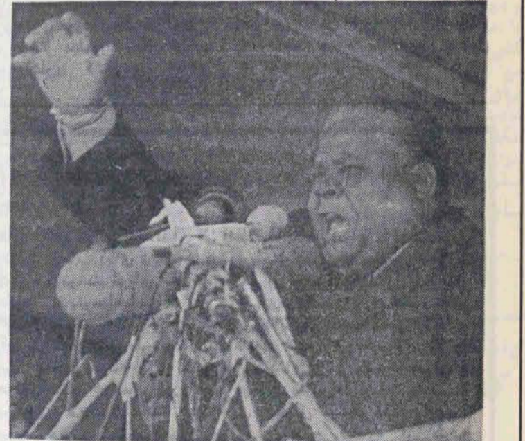
جوشوانکومو رهبر جبهه میهن پرستان رودزیا در حال سخنرانی

س - جبهه میهن پرستان به دو شاخه تقسیم شده است که یکی بوسیله شما و دیگری توسط "رابرت موگابه" رهبری میشود. موگابه امیدوار است که در انتخابات بطور جداگانه شرکت کند. آیا شما از اینکه او در مبارزات سیاسی آینده متحد شما نخواهد بود مأیوس نیستید؟ ج - بله. من علاقه داشتم که با هم می‌ماندیم. من هنوز امیدوارم که او در تصمیم خود تجدید نظر کند.