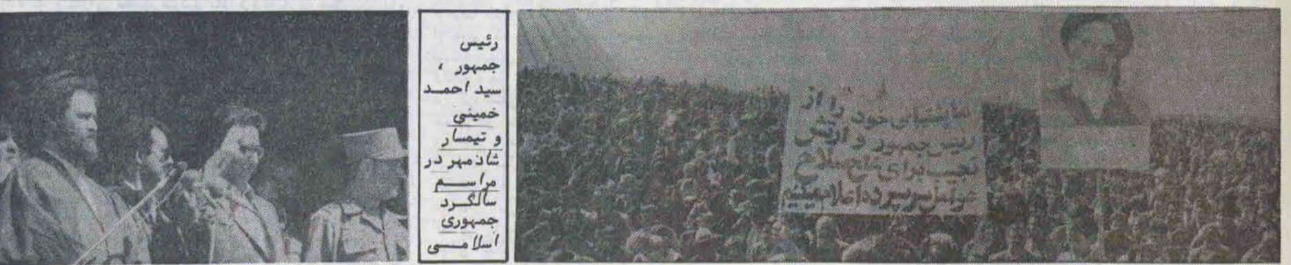
رئیس جمهور، سید احمد خمینی و تیمسار شازمهر در مراسم سالگرد جمهوری اسلامی