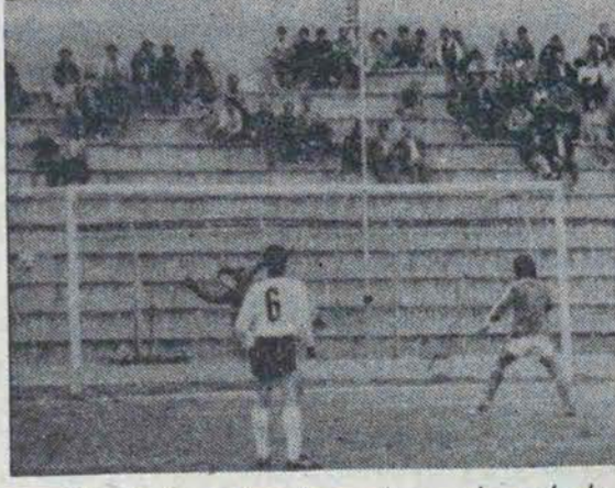
صحنه ای از دیدار پرسپولیس و شاهین که دروازه بان شاهین مغلوب شده است