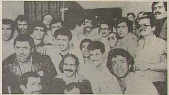
وزیرکاران اتحاد المپیک در حضور رئیس جمهور

در هفته ای که گذشت دکتر ابوالحسن بنی صدر رئیس هیئت مدیره ورزشی انقلاب (تأسیسات ورزشی سابق) حضور پیدا کرد تا با مسئولین سازمان ورزش و ورزشکاران سخن بگوید. در این دیدار تنی چند از اعضای دولت و شورای انقلاب نیز حضور داشتند. ابتدا حسن شاه حسینی سرپرست سازمان تربیت بدنی سخن گفتند. ایشان در ابتدا به بیان مشکلات و مشکلات ورزشی در این کشور پرداختند و به بیان مشکلات و مشکلات ورزشی در این کشور پرداختند. پس از اتمام سخنانشان اشاره کردید بنظر من نتیجه طبیعی بیوری انقلاب است. چون این انقلاب در جامعه جهان پیشگام و پیشرو است و در این کشور با وجود اینکه هنوز در سطح جهانی جایگاه مناسبی ندارد. پس از اتمام سخنانشان اشاره کردید بنظر من نتیجه طبیعی بیوری انقلاب است. چون این انقلاب در جامعه جهان پیشگام و پیشرو است و در این کشور با وجود اینکه هنوز در سطح جهانی جایگاه مناسبی ندارد.