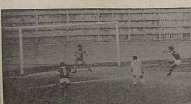
صحنه ای از دیدار بین تیم های پارس و برق که با نتیجه ۱-۱ به پایان رسید

دعوت از فوتبال با استیقای جوان در عصر یکشنبه دیباچه مسابقات فوتبال رده بندی فوتبال در زمین های تهران این دیدارها انجام خواهد گرفت. یکشنبه ۵۹/۱/۳۱ ورزشگاه تختی، ساعت ۱۴ - پوند دو روز یکشنبه ۳ سابقه در ورزشگاه احمدیه انجام گرفت که در پایان این مسابقات بدست آمد.