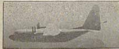
تصویری از هواپیمای تی-۲۸ که آمریکایی متجاوز از این نوع هواپیما جهت تجاوز به جمهوری اسلامی ایران استفاده کرده است.

هلیکوپترهای مهاجمین بوسیله شکارهای نیروی هوایی از کار افتاد