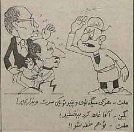
مطلب - هرگز میگویم و پند نمیکنم - سرت و پند بپوش - بکین - آقا غلام کرد بخشید!