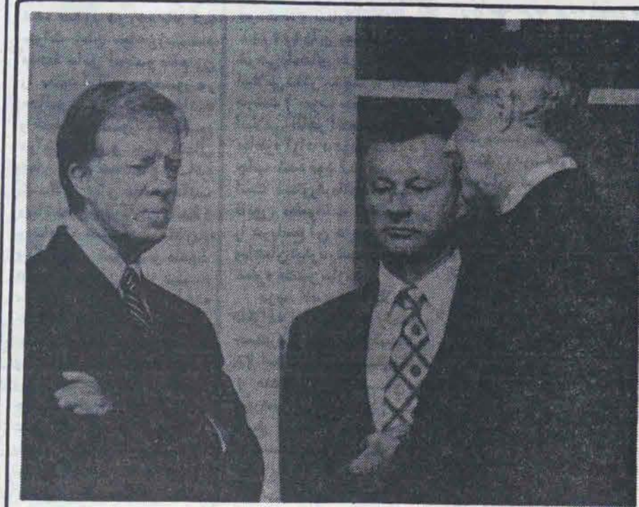
کارتر، ونس، برژینسکی: با ایران چه باید کرد؟

ونس همیشه سعی داشت که از طریق دیپلماسی خواست سرمایه داران را در سرزمینهای دیگران پیاده کند