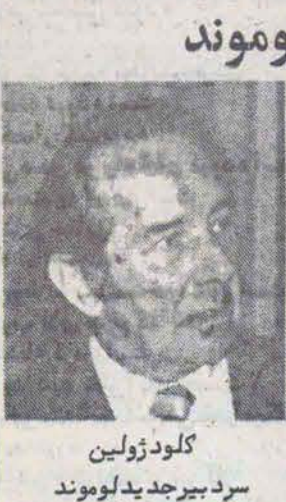
کلود زولین سردبیر جدید لوموند

افتتاح مسجد در فرانسه نانت - خبرگزاری فرانسه اتحادیه اسلامی نانت نانت حاضر شد تعمیر ساختمان کلیسا را که سالها مراسم مذهبی در آن اجرا نمیشده بشهده بگیرد.