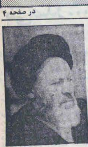
آیت الله موسوی اردبیلی

در انتخاب نخست وزیر باید اساس را بر معیار و ضوابط بگذاریم و نه فرد