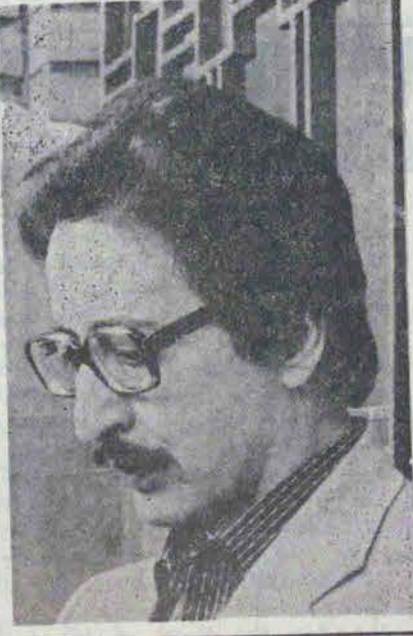
دکتر ابوالحسن بنی صدر

عدهای گمان می کنند نقش رادیو تلویزیون یامداحی است یا فحش دادن بعضی ها هر چه بخودشان مربوط میشود در دل است اما آنچه بدیگران مربوط است کوه میشود