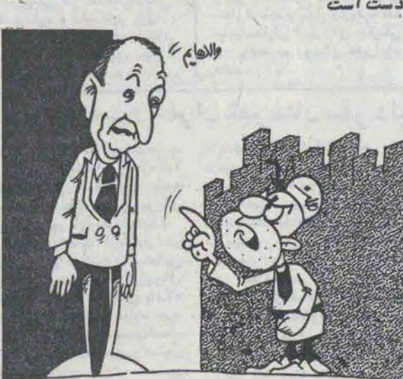
ملت - حتما منتظری وقتی حمام خون راه افتاد یسه اعلامیه آبکی صادر کنی!!

ماسکی، ابتکارات تازه‌ای برای آزادی گروگانها در دست است