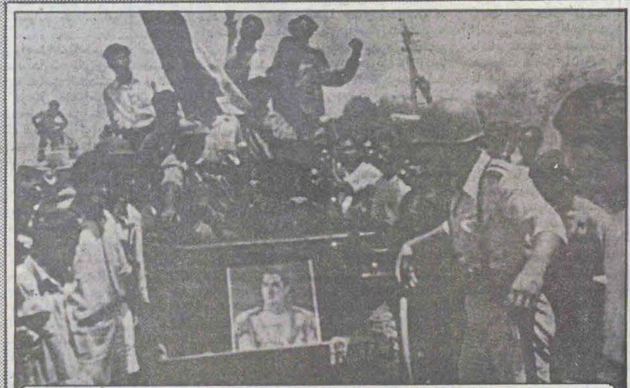
روز ۲۸ مرداد، روزی که کودتا بدست افسران مزدور، ولگردان و فواحش ... با انجام رسید

در اینجا یادی از دکتر مظفر بقائی رهبر حزب زحمتکشان ملت ایران، خالی از قایده نیست، چرا که به هر حال ایشان به مثابه یکی از مهره های وفادار سیاست های بیگانه در جریان کودتای ۲۸ مرداد از مقامی پس والا برخوردار بوده اند! و جریاناتی که امروز در جامعه ما می گذرد ناخودآگاه نام ایشان را در ذهن تداعی میکند. نگاهی گذرا به تیزهای روزنامه ها مدارگان حزب "زحمتکشان ملت ایران" نشان میدهد که آقای بقائی از مدتها قبل از کم و کیف کودتائی