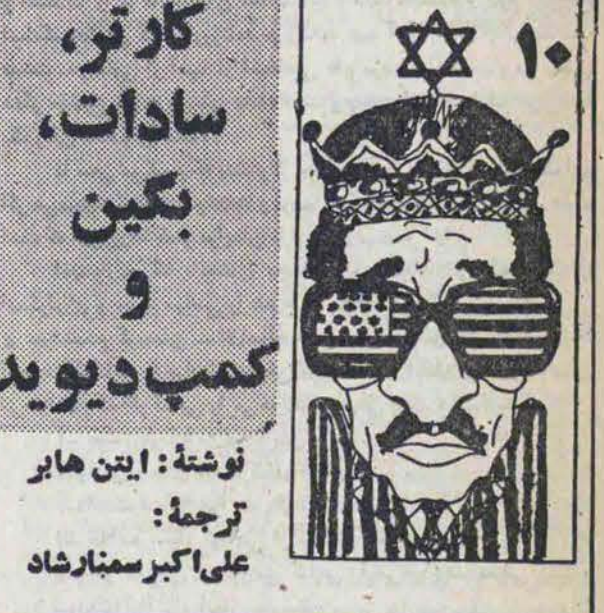
نوشتہ: آیتن هابیر ترجمہ: علی اکبر سنہا شاد

اسلام، عامل جذب و تزکیه و اصلاح و دگرگونی اساسی را دارند به یک عامل دفع و پراکنندگی و تصفیه حسابهای شخصی و گروهی و بهم ریختگی همه چیز، تبدیل میکنند؟! آنها میدانند و توجه دارند که بر اثر پاره ای از عملکردها و شگردهای رشد غیرمکتبی (و صلاحتها) ادعای تنه مکتبی بودن! و منافی با اصول و معیارهای اسلامی پاره ای از افراد، تاجمحد برخطای پرستیز «روحانیت شیعه» که در طول تاریخ با مردم و برای مردم بوده است، به خط افتاده و روز بروز هم دامنه آن دارد و وسیعتر میگردد تا آنجا که به یک «تراژدی دردناک» خدای ناخواسته منجر شود و اگر بخوایم بطور صریح سخن بگویم