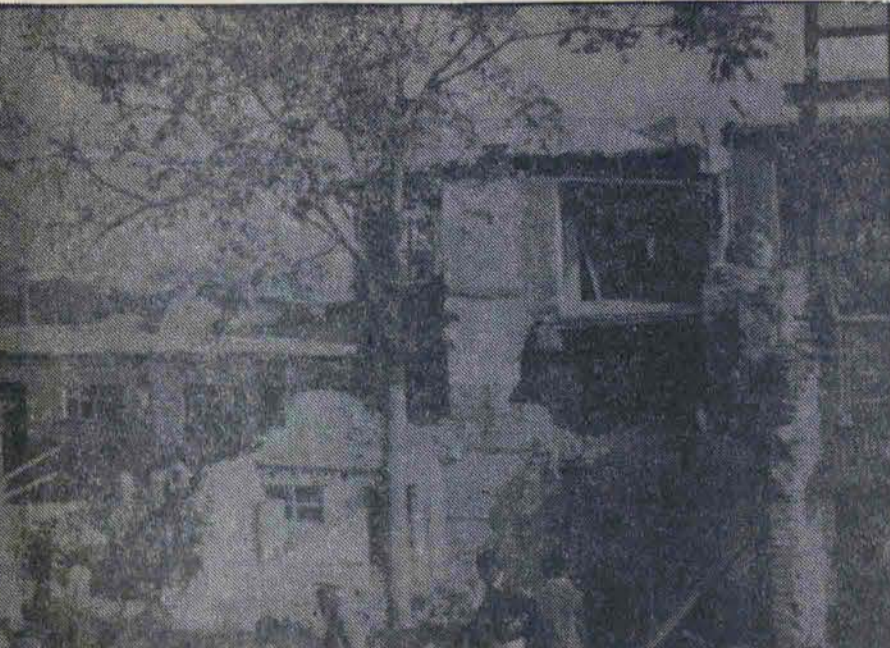
رزمی بعث عراق همچنان مناطق مسکونی را هدف قرار میدهد.

محل استقرار هلیکوپترها، ۲ پادگان و تأسیسات کنار یک آنتن در سلیمانیه منهدم شد در صفحه ۱۵