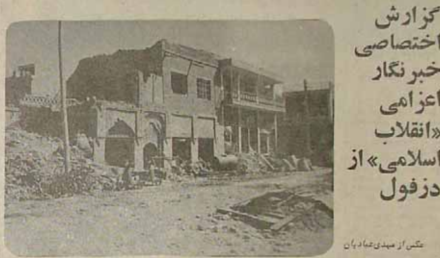
مکن است بتوانند خانه‌های ما را ویران کنند ولی عقیده ما را هرگز...