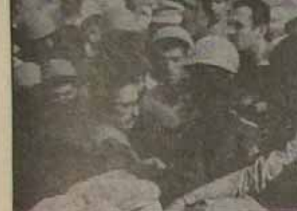
رئیس جمهور در میان مردم دزفول پس از حمله موشکی

نیروهای رزمنده ایران دزفول: اوضاع آرامش نسبی بر خوردار است ایلام: در تمامی جبهه دشمن متحمل تلفات و خسارات سنگین میشود اهواز: زیر آتش شدید توپخانه دشمن آبادان: تهاجم گسترده نیروهای دشمن به شهر خرمشهر: از سر نوشت آن اطلاعی در دست نیست