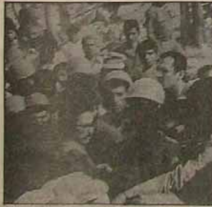
رئیس جمهور در میان مردم دزفول پس از حمله موشکی

پیشروی رزمندگان جمهوری اسلامی ایران در جبهه گیلان غرب