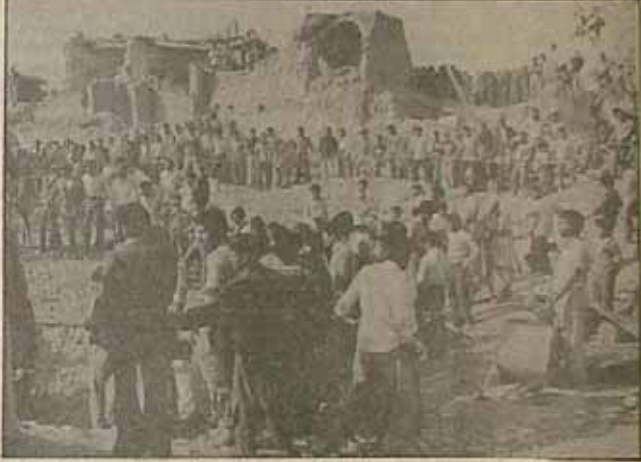
مردم دزفول پس از حمله موشکی در حال کمک برای بیرون آوردن اجساد شهیدان

قصر شیرین: نیروهای دشمن در محاصره رزمندگان اسلام گیلانغرب: ادامه پیشروی نیروهای رزمنده ایران دزفول: اوضاع آرامش نسبی بر خوردار است ایلام: در تمامی جبهه دشمن متحمل تلفات و خسارات سنگین میشود اهواز: زیر آتش شدید توپخانه دشمن آبادان: تهاجم گسترده نیروهای دشمن به شهر