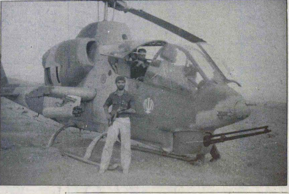
فلاحي جانشين رئيس سادس سرکارتش جمهوری اسلامی ایران - بمباران سربل پهنه زراد فرمانده نیروی زمینی و سرهنگ فروزان فرمانده زاندارم نیروی هوایی جمهوری اسلامی ایران که در یکی از شهرهای

لا یحه ترانزیت کالاهای تجاری بین ایران و شوروی بتصویب رسید ایران و شوروی برای حمل کالا حق استفاده از راههای آبی و خشکی یکدیگر را خواهند داشت در صفحه ۱۱