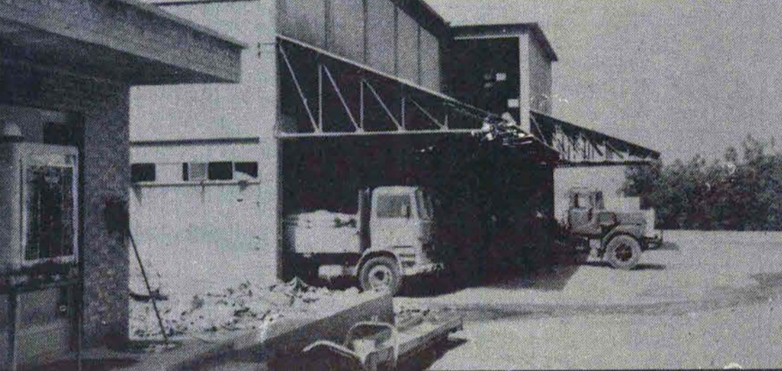
صنعت رسیدگی نکرده و در اطاقهای در بسته و مشورت افراد ناآگاه تصمیم‌هایی میگیرند که بعداً مشکلاتی برای خود و ملت بوجود میآورند...