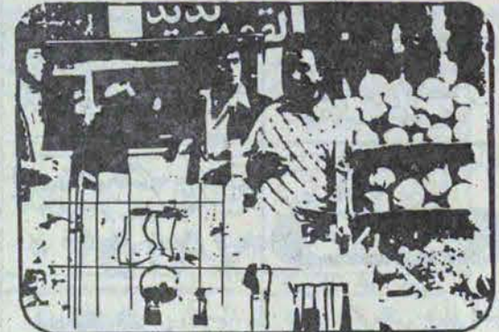
بصورت روزانه در آمده است

را بالا برده‌اند؟ اظهار می‌دارند قیمت مواد اولیه افزایش یافته در نتیجه ما نیز مجبوریم قیمت را افزایش دهیم. برای آگاهی بیشتر در این مورد به بررسی تغییر قیمت چند قلم از کالاهای اساسی می‌پردازیم. بر اساس تحقیقاتی که بعمل آمده است قیمت اجناس ضروری وارداتی وحتی تولیدات داخلی ظرف دو هفته اخیر بطور متوسط بین ۱۵ تا ۲۰ درصد افزایش یافته است. برای آگاهی بیشتر خوانندگان چند نمونه از آنها را ذکر