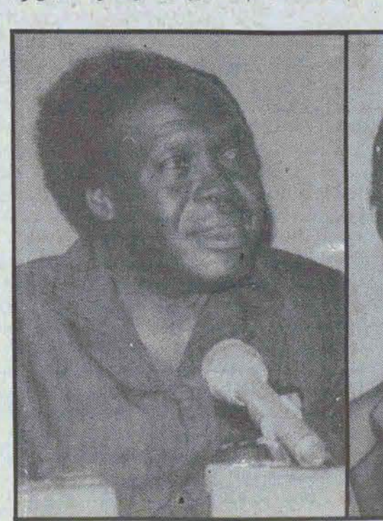
میلتون اوبوته رئیس جمهور جدید اوگاندا

بر اوگاندا نیکمیدت که شوری شورینی، یوسف لولی را به بهانه اعمال روسیهای دیکتاتورانه و عدم مشورت با شورائی که خود لولی آنرا تشکیل داده بود وی را برکنار کرد و "کادفری بنیاسا" که یک حقوقدان بان تجربه بود بریاست جمهوری منصوب نمود. "بنیاسا" هم پس از یازده ماه حکومت در اردیبهشت ماه سال جاری با عزل سرهنگ اوچوک بهانه را بدست نظامیان داد تا تمام مناطق حساس پایتخت را بتصرف خود درآورده و اعلام کردند که یک "کمیسون" فقه نظامی " قدرت را بدست گرفته است. و بدین ترتیب از آن زمان تا هفته گذشته که انتخابات آزاد در اوگاندا برگزار شد نظامیان در رأس قدرت بودند.