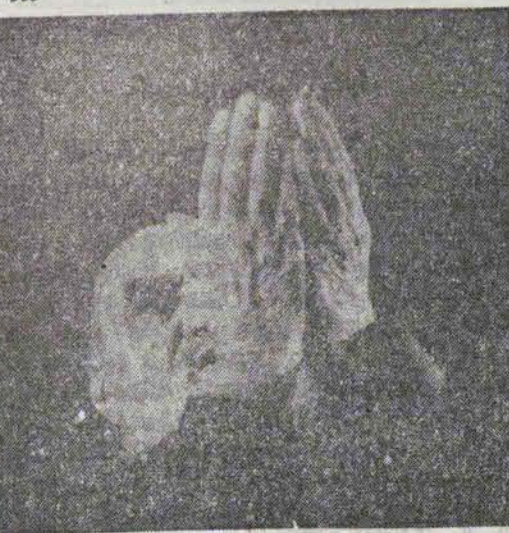
در فرودگاه مرحوم آیت الله طالقانی با آیت الله

روح خدا... به پیغمبری جان خوش آمدی ای مظهر عدالت یزدان خوش آمدی ای از دو چشم منقذات زلفش سوزش آنگه شفته نشسته بر گان خوش آمدی ای از تو پیاپی به آینه توحید استوار ای زنده از تو گنبد قرآن خوش آمدی ای نایب الامام چو پیغمبر سرور ای مجری حکومت "الله" بر زمین ای پیک پیوسته دوران خوش آمدی ای چهره ای غم زده در کمره مرگ شبر ای من مقدمت همه خندان خوش آمدی منبنا من بناب بناریکی دلجم آبادی بکشور ویران خوش آمدی بر چون صاحب رحمت حق زاب زندگسی بر این کویر خشک جو باران خوش آمدی همراه فوج زخبل فرشتگان با چشم تر بگوشه پدیدان خوش آمدی ای رهگشای مکتب اسلام جعفر سوری کردار تو تجسم ایمان خوش آمدی فرزانة رهبر، که عزیز است مقدمت تو در دفتر مردم ایران خوش آمدی "آرزو"