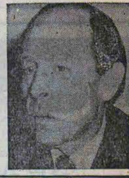
مقاله‌ای از «میشل ژورب» وزیر خارجه اسبق فرانسه بنقل از مطبوعات عربی