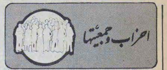
اعراب و مجتهد