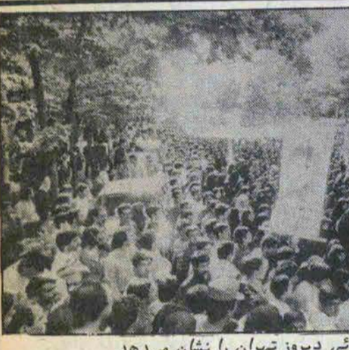
عکس بالا، راهپیمایی دیروز تهران را نشان می‌دهد