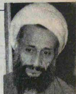
نقل و تلخیص از: اقتصاد اسلامی - علی‌تهرانی