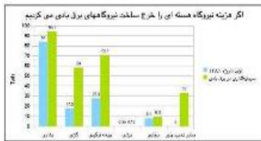
نمودار ۱۰ - مقایسه تولید نیروگاه در سال ۱۳۸۱ و ۱۳۸۹ با فرض اینکه بجای سرمایه گذاری بر روی نیروگاه اتمی سرمایه گذاری بر روی نیروگاه برق بادی می کردیم.

و یا می توانستیم با پول نیروگاه اتمی، نیروگاههای فرسوده خود را نو کنیم و کارایی آنرا لابل تا ۵۰ درصد بالا ببریم. به بیان دیگر با آن پول می توانستیم ۲۰ نیروگاه سیکل ترکیبی با ظرفیت تولید ۱۴۹ ترووات ساعت برق داشته باشیم. تفاوت نیروگاههای جدید و نیروگاههای فرسوده سوختی معادل ۱۴۱ ترووات ساعت که معادل ۸۹ میلیون بشکه نفت در سال و یا بیش از ۹ میلیارد دلار در سال می باشد. علاوه بر این با این اقدام ۲۹ میلیون تن از تولید گازهای گلخانه ای بکاهیم. و یا با تعویض نیروگاههای مستهلک و نصب نیروگاه از نوع CHP با کارایی بیش از ۸۰ درصد از اتلاف انرژی بیش از بدیل سیکل ترکیبی با ۵۰ درصد کارایی جلوگیری کنیم. البته این نوع نیروگاهها احتیاج به شبکه انتقال گرما و یا سرما دارد. اما علاوه بر اینکه ۳۰ درصد از اتلاف نسبت به سیکل ترکیبی که فقط برق درست می کند می کاهد، برای جامعه نیز تا چند دهه کار مفید درست خواهد کرد. زیرا می باید زیر ساخت جدید درست کرد که با این زیر ساخت، علاوه بر بالا بردن کارایی نیروگاه امکان می دهد که انرژیهای که ارزش انرژی کمی دارند (اکسرژی پایین) و در کارخانه های مختلف از این می روند را برای گرم کردن آب استفاده کرد. بنا بر گزارشی که برای اتحادیه اروپا تهیه شده است این نوع نیروگاه نسبت به نوعهای دیگر نیروگاههای حرارتی ارجحیت داده شده است. از این رو مقایسه این روش را نکردم، زیرا برای محاسبات این روش می باید دانست میزان تمرکز جغرافیایی انرژی، وات ساعت در هر متر مربع و توان، وات در هر متر مربع چه میزان است. و در حال حاضر این ارقام را برای شهرهای مختلف در دست ندارم و برای همین تنها به ذکر این روش بسنده کردم.