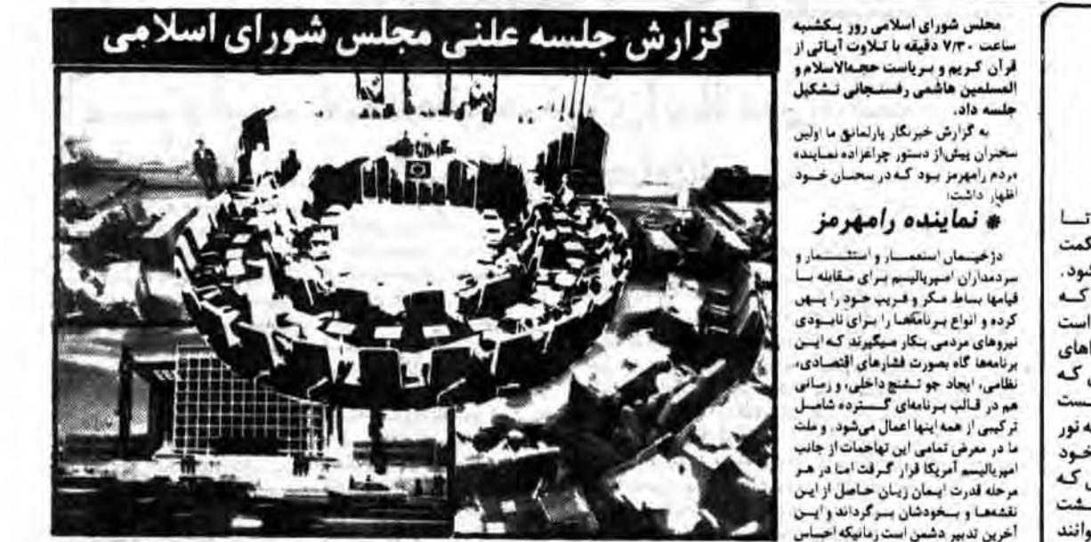
گزارش جلسه علنی مجلس شورای اسلامی

مجلس شورای اسلامی روز شنبه ۱۲ خرداد ماه ۱۳۶۰ در محل وزارت کشور تشکیل جلسه داد. در پایان این جلسه که تا ساعت ۱۲/۱۵ دقیقه به طول انجامید.