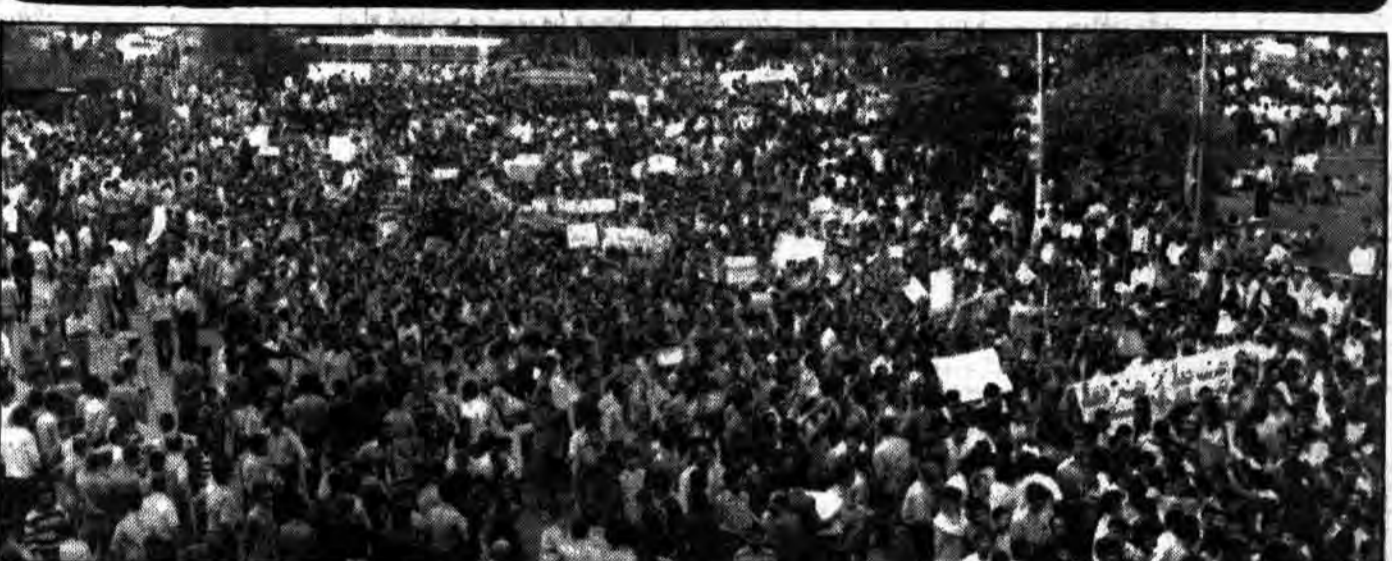
گوشه‌ای از حضور گسترده مردم در صحنه: دیروز حزب‌الله جانی برای حضور ضدانقلاب و منافقین نگذاشت

● آیت‌الله مهدوی کنی وزیر کشور: دفتر هماهنگی قانونی نیست ● امام گفته‌اند که دیکتاتور کیست، کسی که نه مجلس را قبول دارد و نه لایحه‌های آنرا، نه شورای نگهبان و نه شورای عالی قضائی ● وقتی ما را بدآوری معرفی کردید، حالا اگر بر خلاف میل شما حرف زدیم نباید ما را رد کنید ● روحانیت و مردم مسلمان ایران بت شکن هستند و دیگر اجازه نخواهند داد که بت دیگری درست شود. ● اگر مسئولین کاری می‌کنند، مردم می‌دانند که قصد سانسور یا خفقان ندارند، چون آنها خودشان سالهای سال مبارزه کردند.