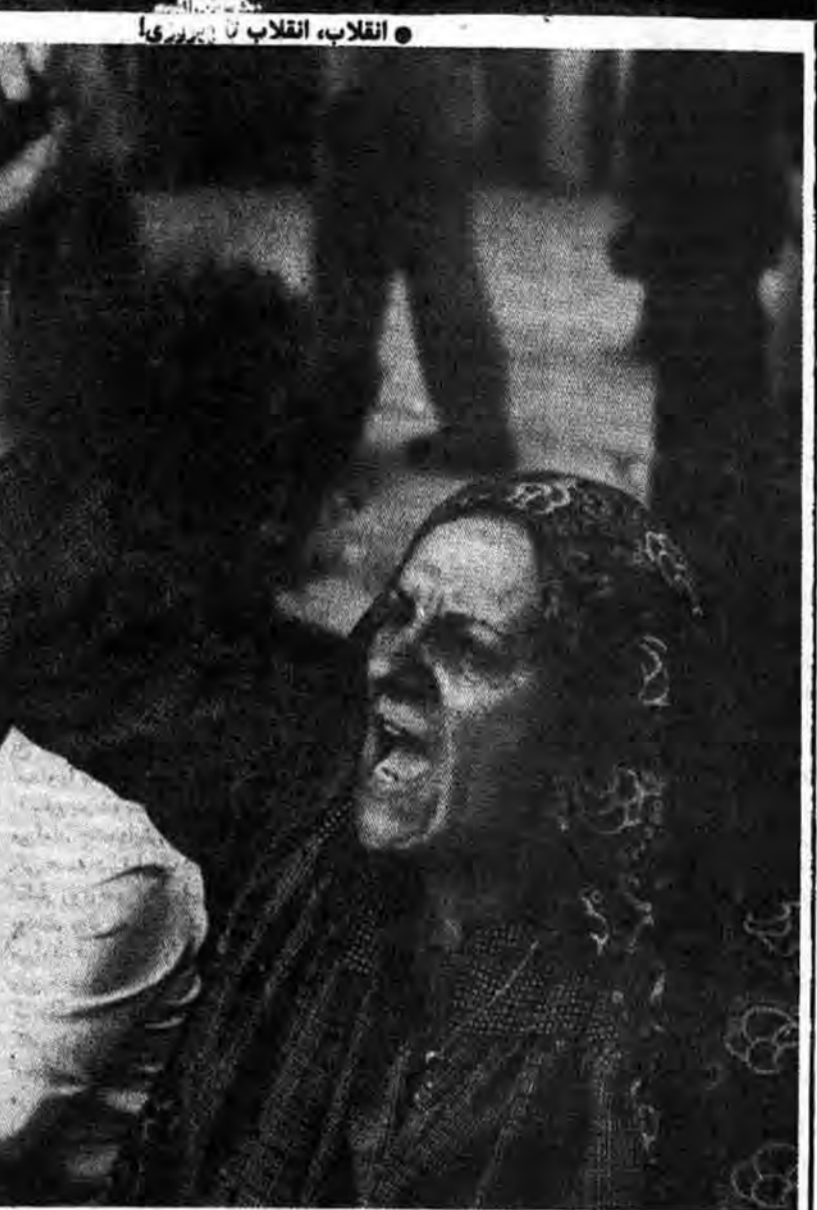
از «کسرست» اینترنشال

از برای یک مسلمان سنی و دفتر رئیس پارلمان برای یک مسلمان شیعه تأمین می‌کرد. سربازان فرانسوی سرانجام در سال ۱۹۴۴ از لبنان خارج شدند، اما لبنان به بی‌ثباتی دائمی دچار است و این وضع در اثر حرص مارونی‌ها برای قدرت و ثروت بیشتر به هزینه اکثریت مسلمان کشور پیچیده شده است. از زمان رفتن فرانسویان، لبنان دو جنگ خانگی را تحمل کرده است. در سال ۱۹۵۸ یک جنگ خانگی کامل عیار در گرفت و آن زمانی بود که «کلیمبل شموون»، رئیس جمهوری وقت لبنان، کوشید تا تسلط کامل مارونی‌ها را اعمال کند. شنگدازان درسیایی آمریکایی در لبنان مداخله کردند تا یک «مشور» ملی را تقریباً فرارادی را برای تقسیم قدرت براساس خطوط سنی (به طوری که «مارونی»‌ها بخش اعظم قدرت را در دست داشته باشند) بپذیرند. این مشور، کرسی‌های پارلمان را میان فرقه‌های گوناگون تقسیم کرد و ریاست جمهوری را برای یک مارونی، نخست‌وزیری