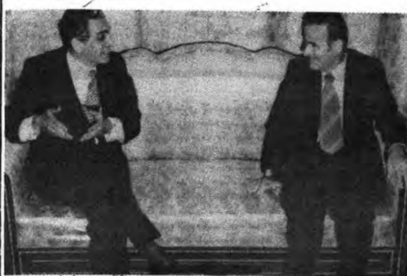
حافظ اسد و سرکره‌های روسای جمهوری سوریه و لبنان

در این میان، «مارونی» اسرائیل، مسیحیان تسخیر کرده‌اند و آن راه نحوی توسعه اسرائیل را ترک کرده‌اند. به هر حال، اسرائیل مسیحیان خود را تاسیس می‌خواهد امپراتوری‌اش را تا کنون، آنها بندر خاص خود متابع رودخانه ولایتی» گسترش در «جونی» یک فرودگاه کامل بدهد. که در همان حوالی قرار دارد و همچنین ارتش و سیستم امنیتی برای یک کشور یهودی (که در سوریه ۱۹۱۹ در وکسفرانس خود را در اختیار دارند در این میان، «مارونی» صلح پاریس ارائه شد، افزون بر هزار و پانصد نفر اسرائیلی فلسطین که هم‌اکنون اشغال شده است، شامل جنوب لبنان تا از تعداد کات تسلیحاتی خود رودخانه ولایتی، جنوب غربی را از جمله تانک‌های خود سوریه و بخش غربی اردن هم از اسرائیل دریافت می‌کنند (بیشتر جنوب غربی سوریه، یعنی جولان، هم‌اکنون آموزش می‌بینند، اخیراً ژنرال اشغال شده است) در مارس و اکتبر اسرائیل، رئیس ستاد ارتش اسرائیل، در بیست و هشتم مارس از «جونی»، پایتخت واداعی بین‌المللی ناگزیر شد از این منطقه خارج شود، اما در این فرماندهی «کتالیه»، گفت‌گو کرد. به زودی پس از آن، «مستأجمن ششتر گذار» که اسما سرگرد بگین، نخست‌وزیر اسرائیل، «مسدود حاد» اما در عمل خود اسرائیلی‌ها آن را کنترل می‌کنند. هنگامی ارتش اسرائیل به «مارونی»‌ها کمک کرده است و اسرائیل همچنان از مسیحیان حمایت خواهد کرد. (باید دانست که در درون خود میراجی» اداره می‌کنند.