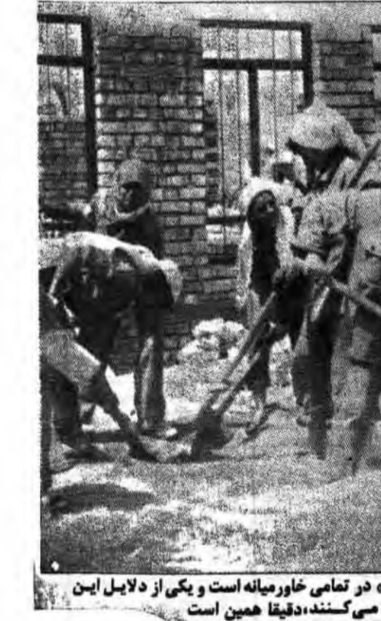
«صدام تکریتی» یکی از مستبران اصلی «سردی مدون» در تمامی خاورمیانه است و یکی از دلایل این که رسانه‌های غربی از او تعریف و تمجید می‌کنند، دقیقاً همین است