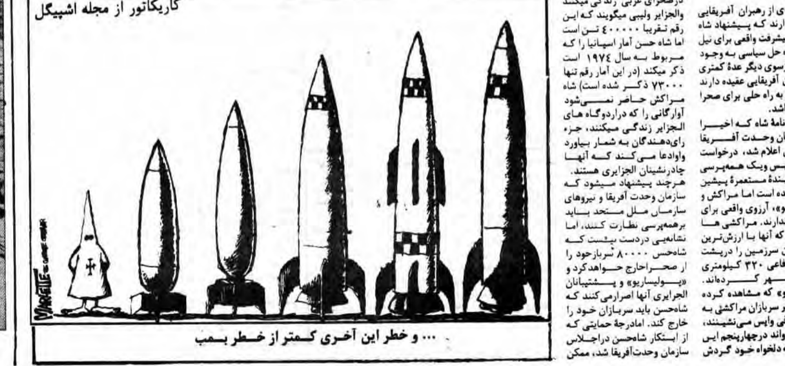
و خطر این آخری کمتر از خطر بمب