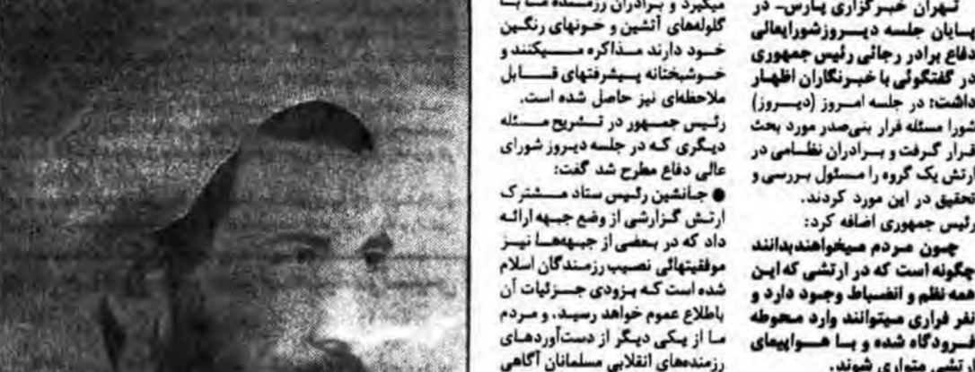
رئیس جمهوری با حضور در مجلس شورای اسلامی، دکتر باهنر را به سمت نخست وزیر منصوب کرد.

تهران خبرگزاری پارس- دیروز جلسه هیئت دولت در حضور اعضای کابینه و رؤسای نهادهای اجرائی و مدیران کل وزارتخانه ها و سازمان ها برگزار شد.