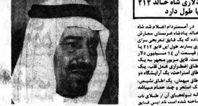
صدام حسین در مصاحبه‌ای با