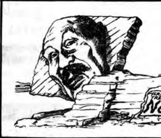
صدام حسین در مصاحبه‌ای با

خبرنگار تلویزیون ان بی سی آمریکا در قاهره در گزارشی گفت اوضاع فعلی در مصر تا حد زیادی شبیه اوضاع ایران در روزهای آخر حکومت شاه میباشد. او گفت امیرا ۳۰ نظامی اتهام اقدام علیه حکومت سادات دستگیر شدند و اورسادات در حال حاضر با مشکلات داخلی روزافزونی مواجه