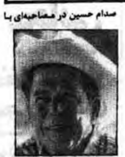
صدام حسین در مصاحبه‌ای با