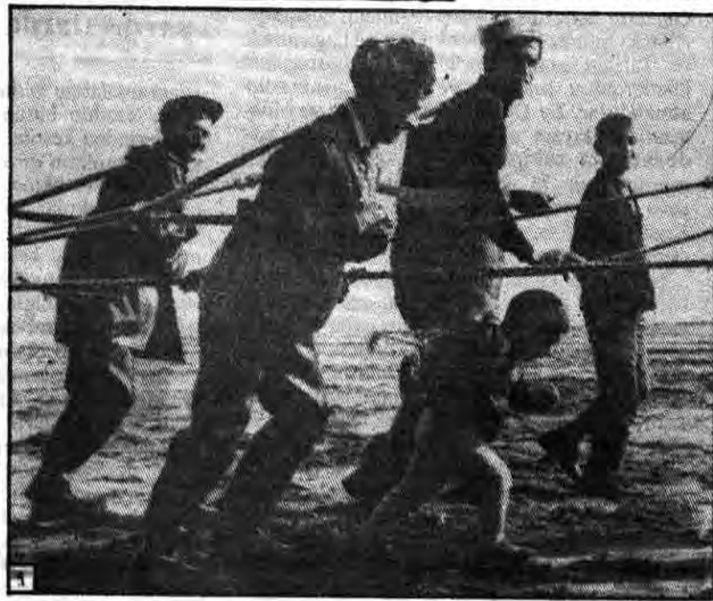
است که بازدید کنندگان با مسابقات کتوتاه بین دو

* برای برگزاری نمایشگاه جهانی عکس کودکان عصر ما، بیش از پنج سال وقت، صدها هزار دلار هزینه صرف شده بود.