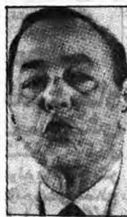
ملاقات طولانی صحبت‌های عمده (از مجله النهار السری والدینی).

کارشناسان امریکایی در عربستان مجله لیبنتی الکفاح العربی نوشت: انتظار میرود، (۴۰) اسر و تکسین امریکایی وارد عربستان سعودی شوند تا دستگاههای لازم را جهت بکار انداختن هواپیماهای امریکایی (واکس) که در اوایل ۱۹۸۵ به عربستان سعودی تحویل داده میشود نصب نمایند. گزارش شاه مراکش... در ملاقاتی که میان پادشاه عربستان سعودی و شاه مراکش صورت گرفت و در آن ابویاد نیز حضور داشت، صحبت از دیدار شیخون پیرز رهبر حزب کارگر اسرائیل به مراکش میان آمد. شاه حسن در این مورد به عرفات گفت: پیروان گذرانده امریکایی و بدعوت رهبر طایفه یهودی در مراکش وارد این کشور شد و در یکی از مناسبتها با من ملاقات کرد و در این