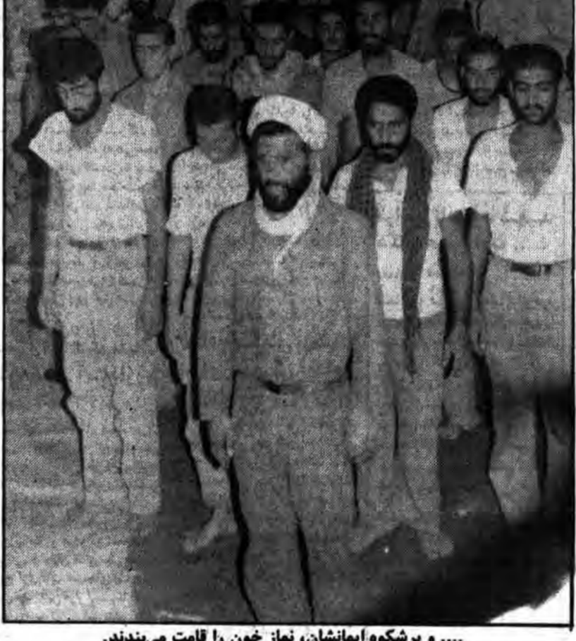
.... و بر شکوه ایمانشان، نماز خون را قامت می‌دهند.

اطلاعیه دفتر حزب جمهوری اسلامی اصطبلات خیرنگار جمهوری اسلامی - این اطلاعیه در رابطه با شهادت حاجتالاسلام حاج شیخ احمدقاسمی حاکم شرع منطقه شرقی فارس از سوی دفتر حزب جمهوری اسلامی اصطبلات انتشار یافت: بسمه تعالی