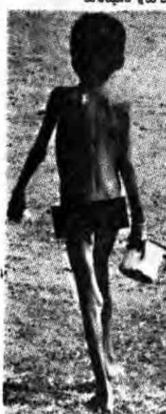
به غریبان بودنش خرد

دیگر نقاط جهان به اصطلاح پیش رفته بدان، متلاطمند. کودکان بزرگتر همواره اولین کسانی هستند که متلاطمه بیماری و سرانجام مرگ میگردند، زیرا آنها به غذای بیشتری نیازمندند، و اکثر آنان بطور جدی واد ساری از کمپای غذا رنج میبرند. این چنین است و شاید به همین سبب است که ماه اردیبهشت را «ماهی سس» در انتظار غذا بسر سسند نامیدند.