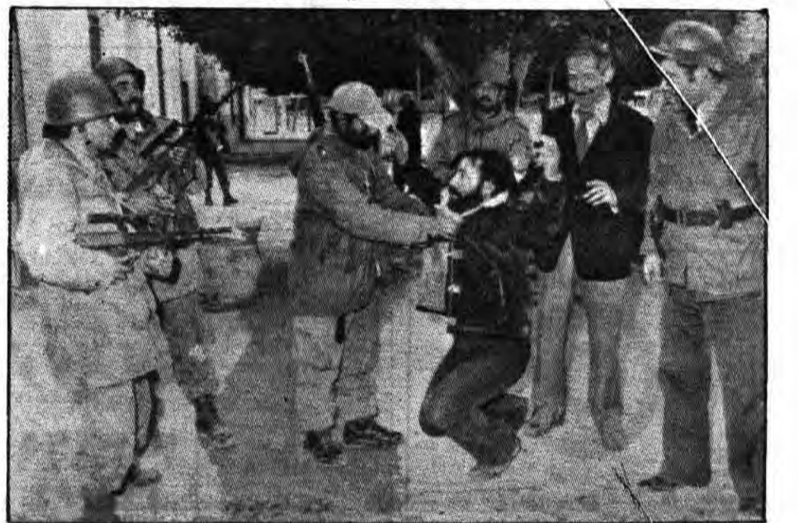
یک دانشجوی تونسی توسط پلیس دستگیر شده است

جنبشها که قبلاً امیداندگی نسبت به امکان برپایی حکومت اسلامی در کشورهای مسلمان و عرب داشته اند، اینک با الهام از انقلاب اسلامی ایران فعالیت های خود را چند برابر کرده و دقیقاً حاصل کرده اند که اگر سوسیالیست ها و کمونیست ها در این کشورها فعالیت میکردند، همین امروز در این کشورها حکومت اسلامی برپا نمیدادند.