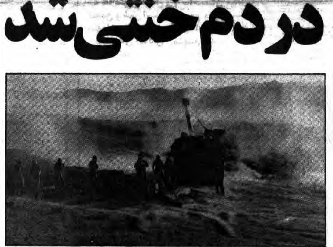
مواقع نیروهای اشغالگر صدام لطمه‌ای از آتش دشمن سوز آتش اسلام در امان نبوده و قوای پرتوان اسلام با حملات بی دریغی خود خیالهای خام سران این کافران را به یاس تبدیل می کند