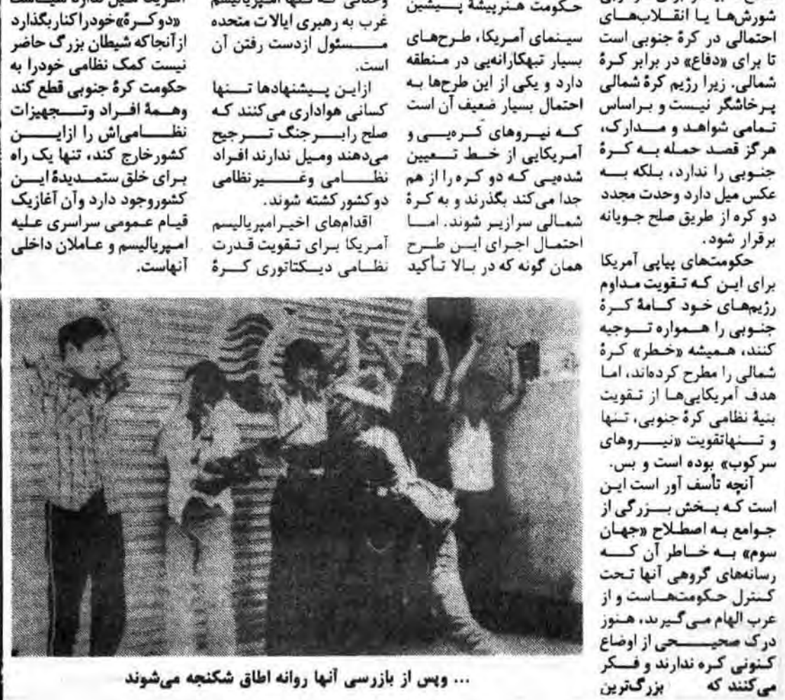
... و پس از بازرسی آنها روانه اطاق شکنجه می شوند.

قدرت امپریالیستی غرب، تنها برای آن کره جنوبی را مسلح می کند که بتواند با «حمله» کره شمالی مقابله کند. در هر حال، در بیانیه‌ی که پس از گفتگوهای وزیران دفاع ایالات متحده و کره جنوبی منتشر شد، حتی آمده است که آمریکا کمک سریع و موثری را برای کره جنوبی تأمین خواهد کرد تا تسول حمله مسلحانه به این کشور را دفع کند. این روزها تشنج در شبه جزیره مستعدیده تصاعد می یابد و مسئول این تشنج هیچکس جز حکومت تشنج تپکار آمریکا و کره جنوبی نیستند. مانورهای مشترکی که آمریکا با کره جنوبی انجام دادند، نشان می دهد که حکومت هرنیشتیم پیشین سینمای آمریکا، طرحهایی بسیار تپکارانه‌ی در منطقه دارد و یکی از این طرحها به احتمال بسیار ضعیف آن است که نیروهای کره‌ی جنوبی را از زمین و آسمان خارج کند، تنها یک راه حل تعیین نظامی و غیر نظامی جدا از هم بگذرند و به کره شمالی سرازیر شوند. اما احتمال اجرای این طرح همان گونه که در بالا تأکید