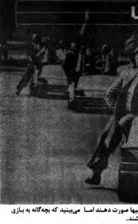
ریگان و دیگر سران کشورهای غربی در اوتوا گرد هم آمدند تا به اصطلاح به نایسانانها صورت دهند اما می بینید که بچه گانه به بازی پرداخته و عازم زمین بازی میباشند.

مهربان در بهم آمیختن «احتیاجات» و «خواهشها»، البته مسئله دیگری هم هست و آن رها کردن ارزشهای انسانی در سطح متوسط میباشد، آنگاه که به وفور نعمت اقتصادی دست یافت. طبق اظهارات یانکلوویچ، آمریکاییان باورشان شده که میتوانند بدون کار کردن هم ثروت داشته باشند و هم هر آنچه که دلشان میخواهد انجام دهند، یعنی آزادی جنسی بدون مسائل زناشویی و خودپرستی بدون از دست دادن اجتماع. بعد وقتی یانکلوویچ و جنسین استدلال میکنند، که این آشفتهگیها بوجود نیامده، مگر بوسیله استعدادهای تحمل پرستی و پوچ گرائی مردم، و تمایل