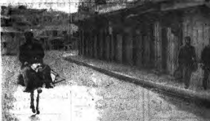
سربازان صهیونیستی در خیابانهای کرانه غربی رود اردن

ایا زمان آن فرا نرسیده که وجدان طرفداران حقوق بشر بیدار شود و این همه ظلم و ستم را ببیند؟ طرفداران حقوق بشر بخوبی از این جنایات آگاهند و باطرز رفتار سربازان اسرائیلی آشنا هستند ولی وظیفهشان اینست از حقوق مستکبران صهیونیستی که از جنایاتشان دفاع نمایند و مردم مستضعف را که برای کسب آزادی و استقلال مبارزه میکنند بخاطر خواستهای مرفهانه سرزنش کنند که چرا از مطالبه حق خود دست بر نمی دارند و تسلیم زورماران نمی شوند.