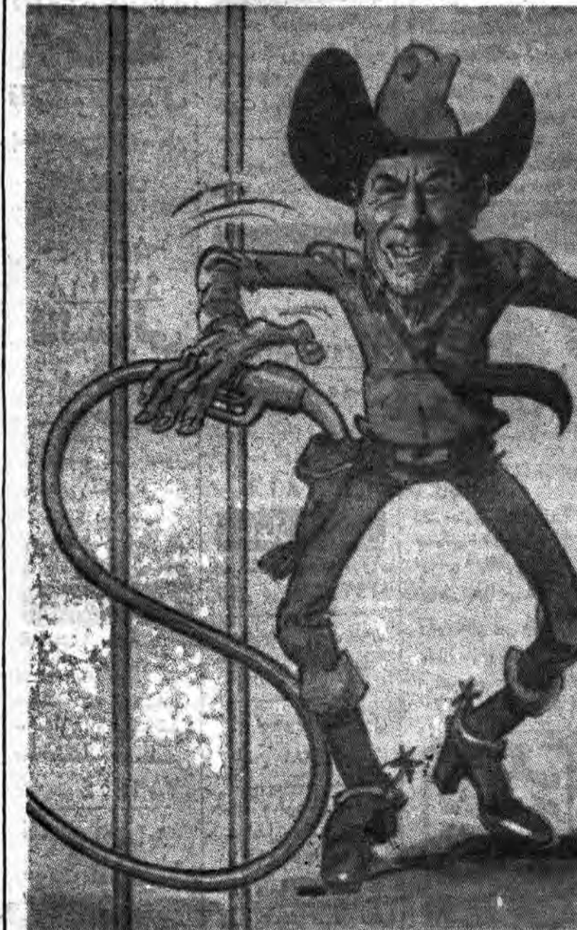
دلارهای نفتی بجای اسلحه! (کاریکاتور لره روزنامه ملت، چاپ تبریکه)