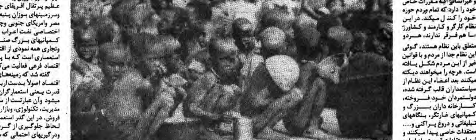
نگاههای نفرت انگیز میلیونها مستضعف گیتی به دستهای خون آلود استعمارگران دوخته شده

یکی از ابعاد آن، نظام اقتصادی است که در حدی وسیع و گسترده شامل یک سلسله روابطی میشود که در حوزه استعمارگر و استعمار شده بوجود میاید یعنی اولی مرکز فرماندهی و اخذ تصمیمات است و دومی مرکز افراد شغل آن است. سرمایه داری میکند. کنترل در اینجا، اشکال مختلفی بخود