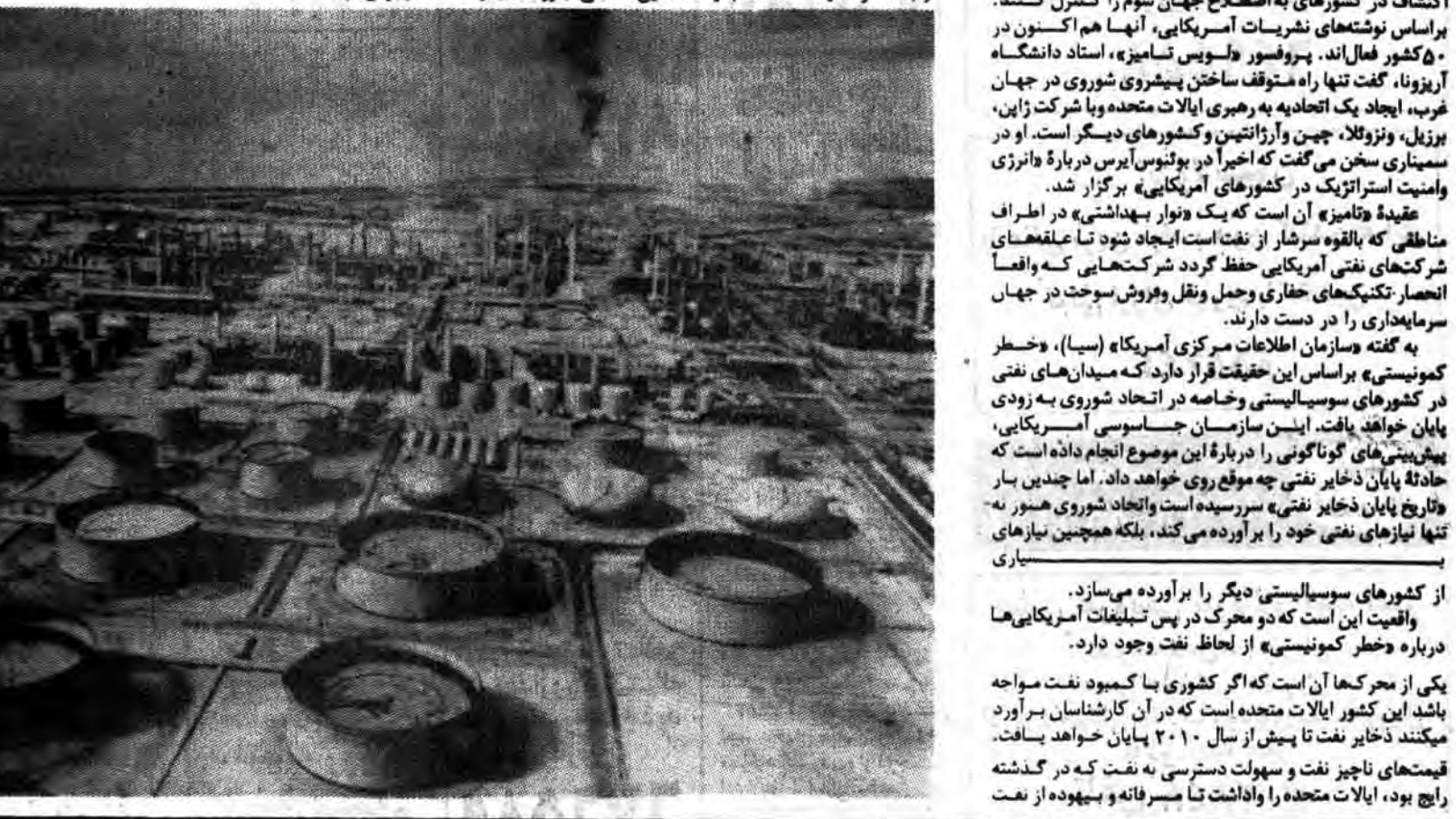
به گفته سازمان اطلاعات مرکزی آمریکا (سیا)، خطر کمونیستی بر اساس این حقیقت قرار دارد که میدان های نفتی در کشورهای سوسیالیستی و خاصه در اتحاد شوروی به زودی پایان خواهد یافت. این سازمان جاسوسی آمریکایی، پیش بینی های گوناگونی را درباره این موضوع انجام داده است که حادثه پایان ذخایر نفتی چه موقع روی خواهد داد. اما چندین بار تاریخ پایان ذخایر نفتی سرسیده است و اتحاد شوروی هنوز تنها نیازهایی نفتی خود را برآورده می کند، بلکه همچنان نیازهایی از کشورهای سوسیالیستی دیگر را برآورده می سازد. واقعیت این است که دو محرک در پس تبلیغات آمریکایی ها درباره خطر کمونیستی از لحاظ نفت وجود دارد.

استفاده کثرت و این موضوع نگذاشت که ایالات متحده به آینده بگردد و ماهیت تجدید شدنی نفت را در ذهن داشته باشد برای صنایع، نیروهای مسلح و زیربنایی که پایه اش اصلاً روی نفت باشد. نمیتوان به آسانی منابع دیگر انرژی پیدا کرد - و صنایع، نیروهای مسلح و زیربنای ایالات متحده بر پایه نفت قرار دارد. این موضوع بسیاری از کارشناسان را وامیدارد تا باور بدارند که ایالات متحده به زمان طولانی نیاز خواهد داشت تا به منابع دیگر انرژی روی بیاورد. در طول این زمان، ایالات متحده به همان اندازه به نفت نیاز خواهد داشت که اکنون نیاز دارد و این نفت با قیمت های بسیار بالا تر به دست خواهد آمد. عامل دوم ماهیت نظامی دارد، اما این عامل با عامل اول ارتباط دارد. ایالات متحده به یک ماشین نظامی نیرومند نیاز