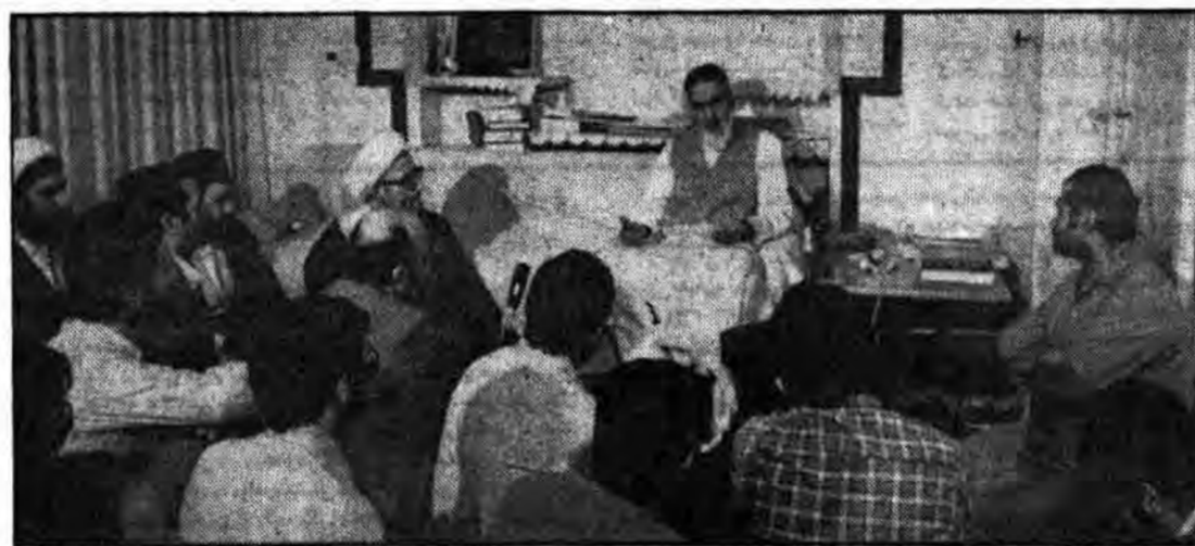
نخست وزیر در حضور امام:

تمام تر و رهاوی هم رفته که بگذارند تا آخر هم وقتی بشود به اندازه ۱۷ شهریور ما شهید نمی دهیم