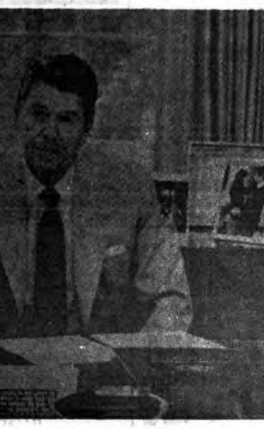
میتواند. مثلاً میس برای ثبوت قدرت خودروی ریگان دویسار در طول هفته موجب شد که ریاست جمهوری بصورت یک احیای در انتظار همومی واریاب...

کنفرانس کشورهای صنعتی کاملاً محسوس بود. یکی از مشاوران نزدیک ریگان اظهار داشت، او (ریگان) هنوز موضوع در آتوا محل برگزاری