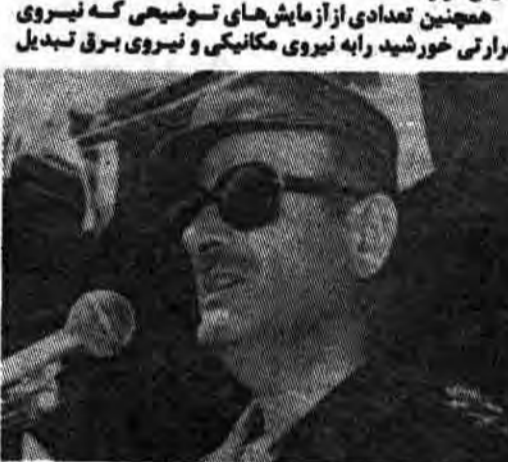
می نماید نیز بعرض نمایش قرار گرفت...