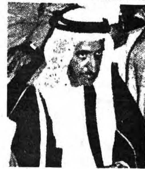
تحریم کالاهای امریکائی