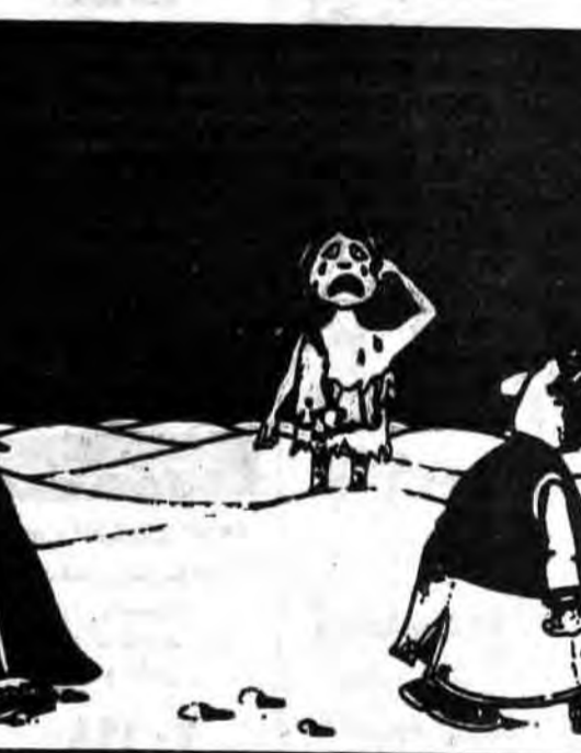
در باغ نیست و هرگز نخواهد بود...

کنفرانس کشورهای صنعتی کاملاً محسوس بود. یکی از مشاوران نزدیک ریگان اظهار داشت، او (ریگان) هنوز موضوع در آتوا محل برگزاری