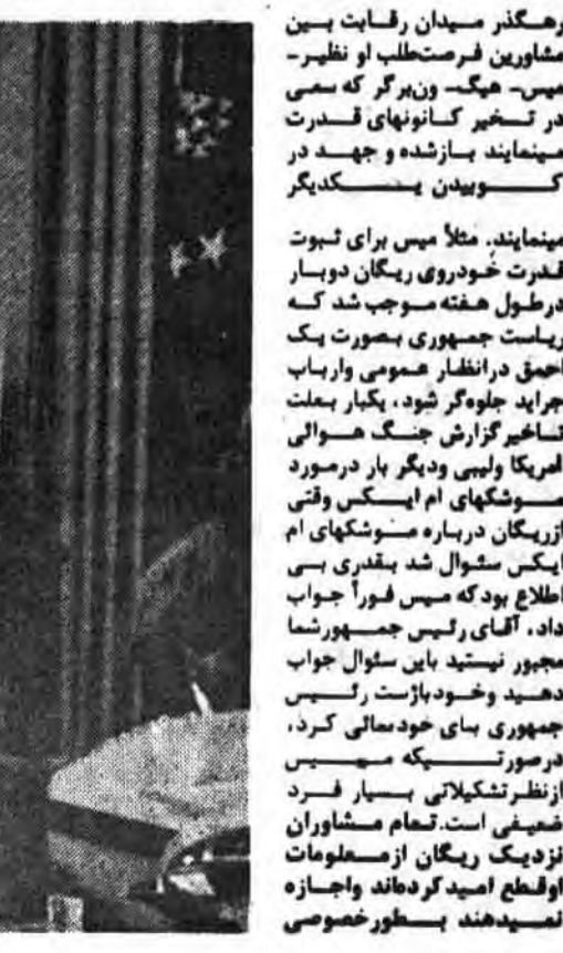
میتواند. مثلاً میس برای ثبوت قدرت خودروی ریگان دویسار در طول هفته موجب شد که ریاست جمهوری بصورت یک احیای در انتظار همومی واریاب...

رهگذر میدان رفقای حسین مشاورین فرستادگان او نظیر- میس- هیک- ون-رگر که میس در قرارداد گمانهای قدرت متعده می نمایند باز شده و جهه در کسب ویند بسکتدیکر