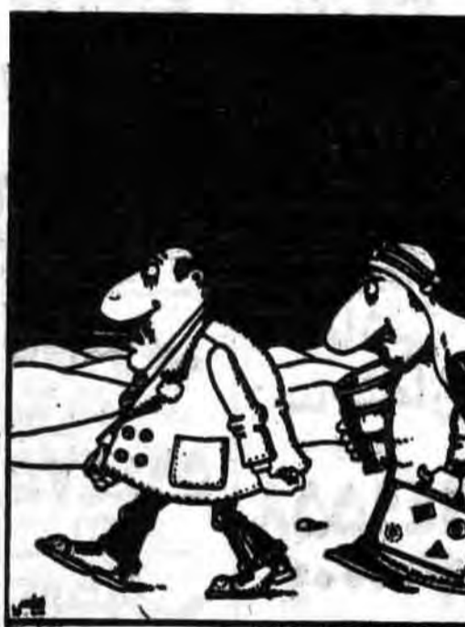
والسلام هلیکم ورحمتاله ویرکاته