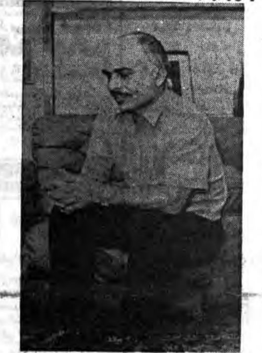
منابع دیپلماتیک عربی گفته اند...