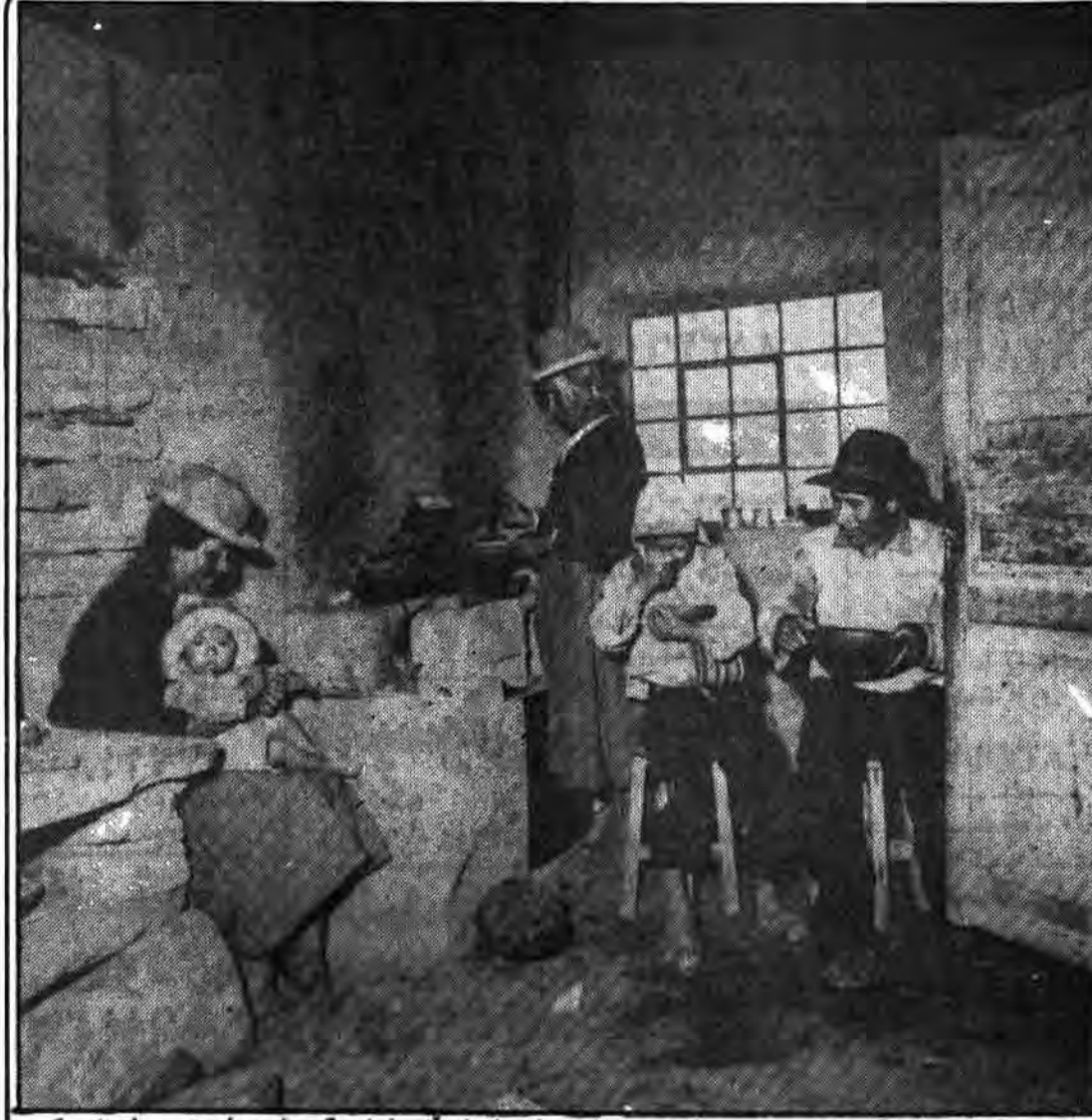
سرخ پوستها (بومیان) آمریکای جنوبی، که دست استعمار برادران آنها را در گویان برای همیشه نابود کرد.