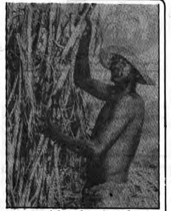
«سیاه سرگردان» فرق نمیکند در کدامین سرزمین باشند، زیرا ظلم و استعمار سفیدهای وحشی در همه جا پراکنده است.

کشاورزی در جلگه‌های ساحلی متمرکز است و سیستم کوچ‌نشینی برقرار میباشد. معادن با سرمایه‌گذاری خارجی به سرعت در حال توسعه و بهره‌برداری است و بخش کوچکی از نیروی کار را بوجود جذب کرده است. این کشور یکی از تولیدکنندگان سنگ آلمینیوم در جهان است، که یک چهارم ارزش صادرات کشور را تامین میسازد. دشتهای مرتفع نیز بعد کثافی از صنایع الماس، طلا و چوبهای جنگلی برای صادرات برخوردار میباشد. اما بهره‌برداری از سنگ شیشه در ۱۹۶۸ متوقف گردید، چنین صنایع سبک تولید مواد غذایی، روغن، پوشاک و تولیدات چوبی دایر میباشد، با این وجود مواد حوراک زیادی از خارج وارد میگردد علاوه ماشینی آلات، نفت، سوخت و دیگر لوازم زندگی ارتباطات بارگانی عمدتاً با انگلیس و آمریکا میباشد. جرج تاون بندر اصلی