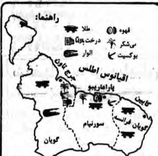
راهنما: شهر، می‌شکر، بوکسیت، آقیانوس اطلس، پاراماریبو، سورینام، گویان

رودخانه اصلی که واسکویو نام دارد، دارای ۶۶۴ کیلومتر طول و کشور را به دو بخش تقسیم میکند (از طرف جنوب به شمال). بیشتر طول رود بخاطر جریانات شدید آب و وجود آبشارها در حد کثیرانی نیست، و در نقاط دیگر این امر بسیار کند انجام میگردد. برای نمونه میتوان آبشارهای «کالی تورو» را بر فراز رود پورتارو نام برد که بسیار هم زیبا و دیدنی میباشد. بارش باران بسیار سنگین و در سال دو فصل بارانی وجود دارد. در سطح کشور درجه حرارت بسیار بالا است، با این وجود آبوهوای جلگه‌های ساحلی به سبب تغییر بادها متعادل میباشد.