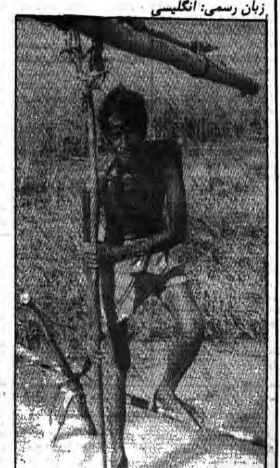
در گویان با هر جای دیگر، او بهر گها که رود استعمار همین رنگ است.

جمعیت: ۷۸۰،۰۰۰ نفر تقریبی (ومسلمانان ۵ تا ۱۰ درصد) زبان رسمی: انگلیسی